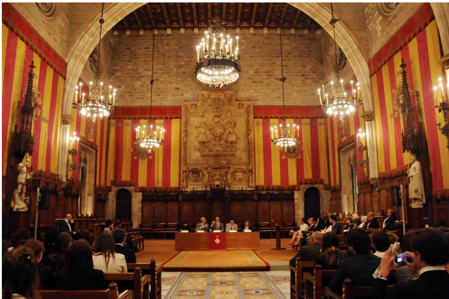
Inaguración del C'MUN 2013 en el Saló de cent del Ajuntament de Barcelona