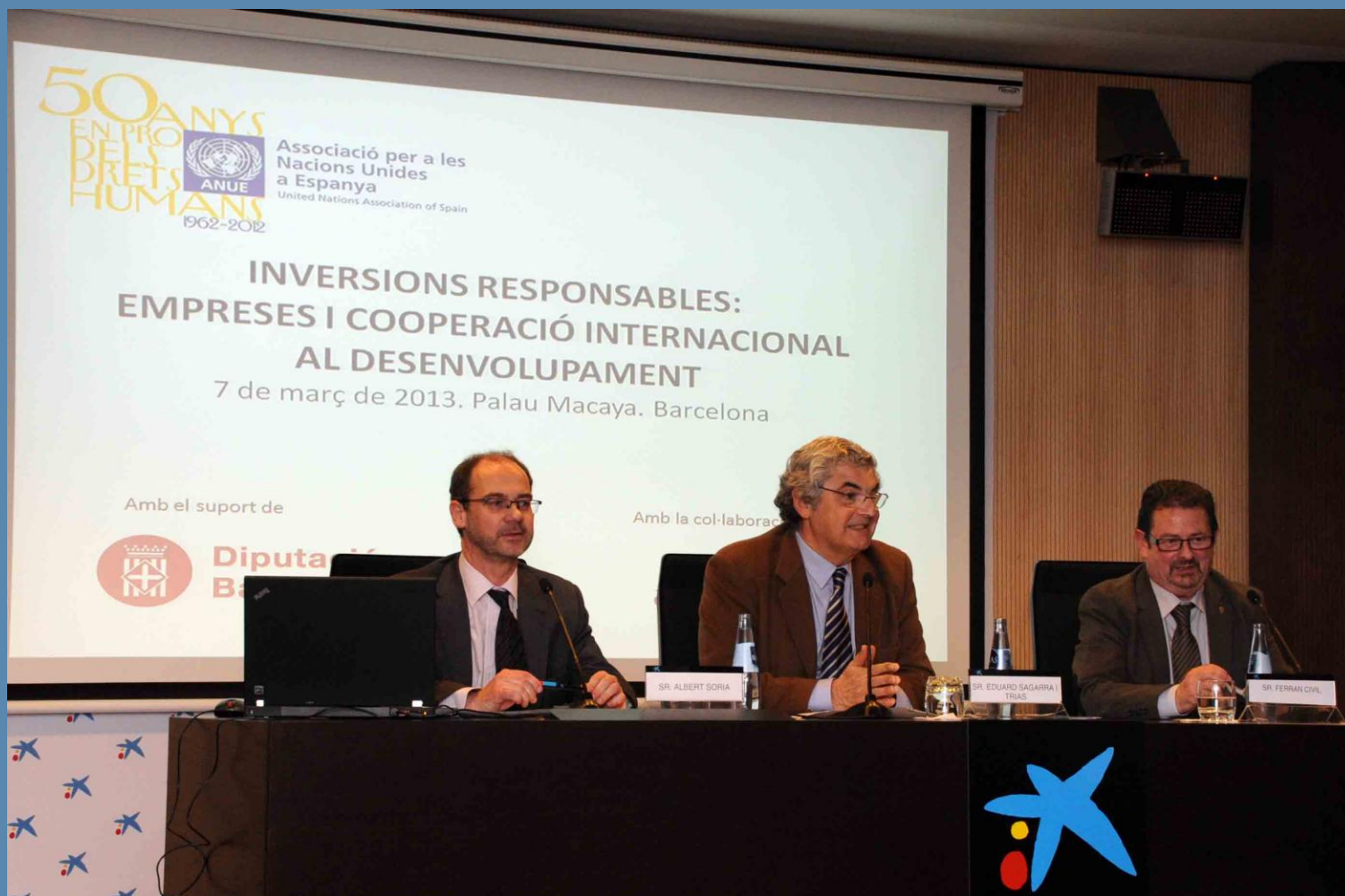
Seminario celebrado en el Palau Macaya de la Fundació La Caixa sobre "Inversiones responsables: empresas i cooperació internacional para el desarrollo", con el apoyo de la Diputació de Barcelona.