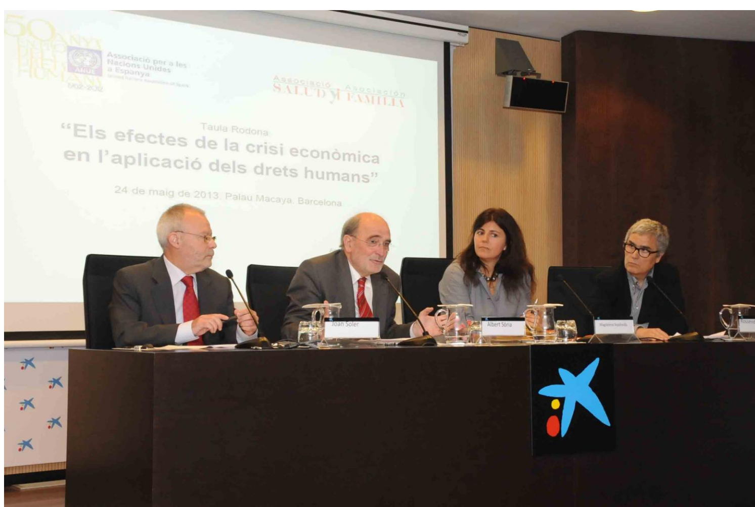
Seminario celebrado en el Palau Macaya de la Fundación La Caixa sobre “Los efectos de los efectos de la crisis económica en la aplicación de los derechos humanos”, con la relatora de extrema pobreza y derechos humanos de las Naciones Unidas Sra. Magdalena Sepúlveda.