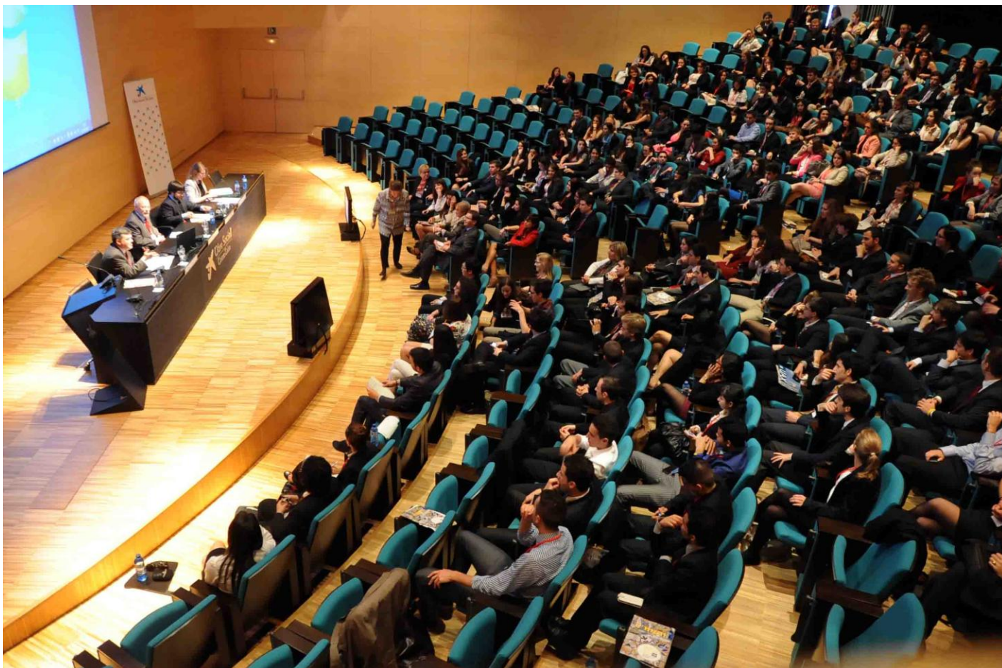
Clausura del C'MUN 2013 en CosmoCaixa