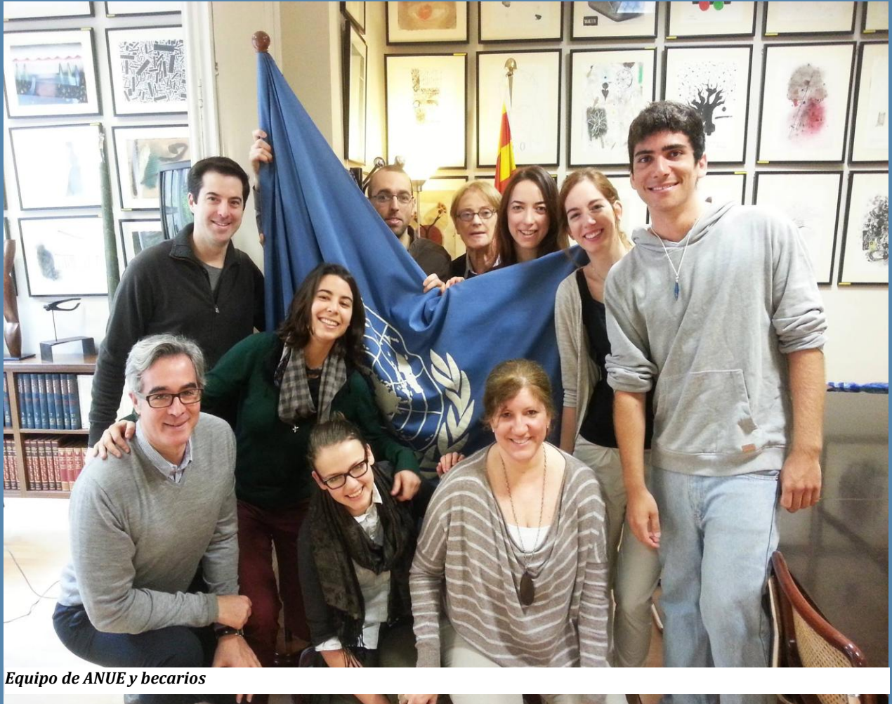
Equipo de ANUE y becarios