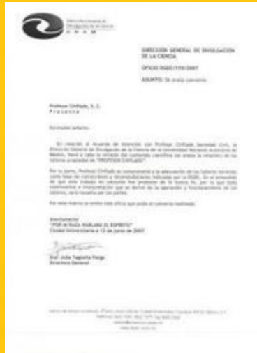
Centro de Divulgación de Ciencias de la UNAM