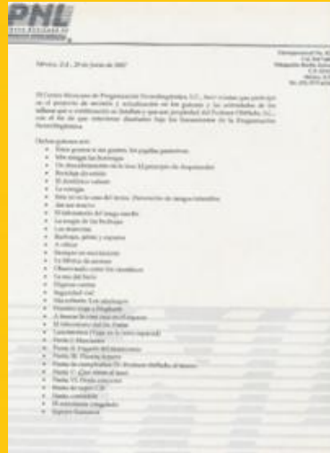
Centro Mexicano de Programación Neurolingüística