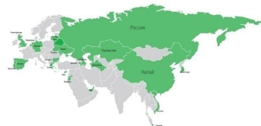
География экспортных поставок

ОАО «Савушкин продукт» уделяет огромное внимание обеспечению доступности своей продукции в розничной торговле. Товаропроводящая сеть компании на территории Республики включает 6 торговых филиалов: в Минске, Гомеле, Витебске, Могилеве, Гродно, Пинске. В крупных районных городах страны работают торговые представители. Интересы компании за рубежом также представляют многочисленные партнеры.