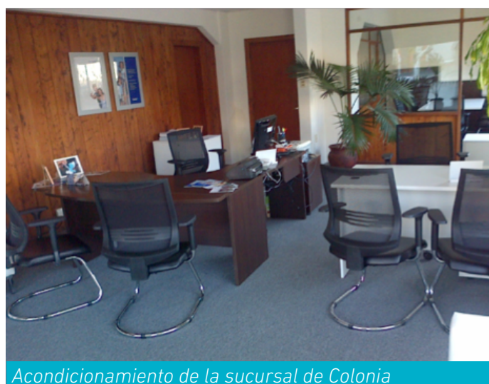
Acondicionamiento de la sucursal de Colonia