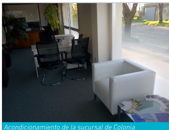
Acondicionamiento de la sucursal de Colonia