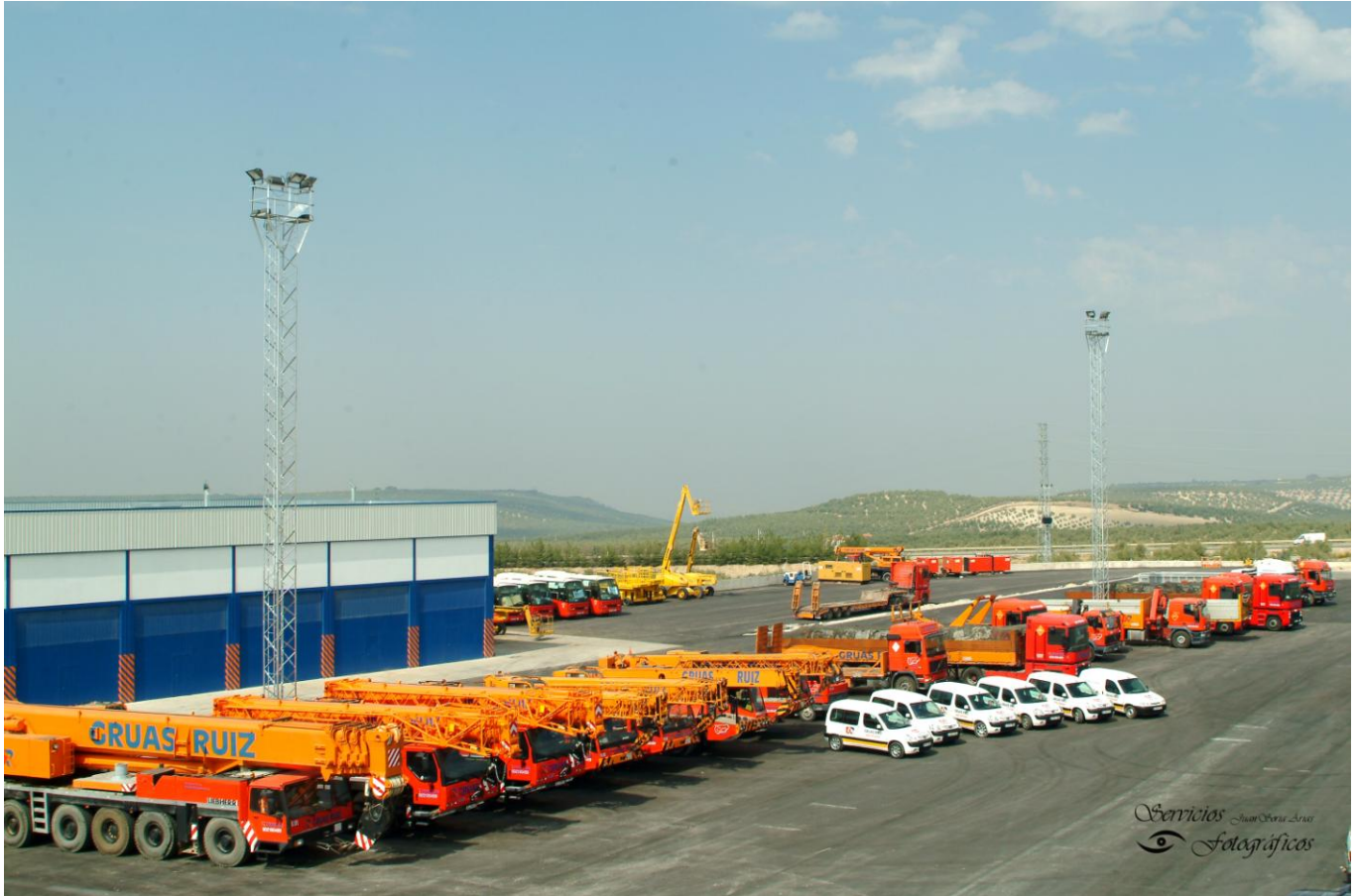
Foto de la Sede Central de Grúas Ruiz SAU en Úbeda