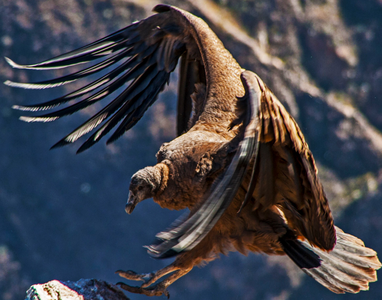
Cóndor andino (Vultur gryphus)