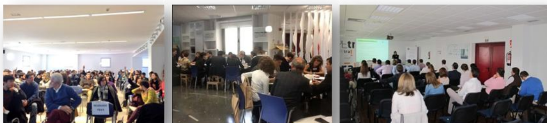
Ilustración 4: Imágenes de jornadas formativas en las que ha participado Factor CO 2 durante 2013

Asimismo, durante 2013 Factor CO 2 ha celebrado un mínimo de 15 jornadas formativas destinadas a informar a la sociedad sobre la importancia de proteger el medio ambiente y fomentar la sostenibilidad. De esta forma, se han llevado a cabo sesiones en numerosos centros, tanto formativos como profesionales, para diversos públicos: estudiantes de edades comprendidas entre los 5 y los 25 años y público más maduro de perfil profesional. Este hecho ha sido también comunicado a través de las herramientas de difusión existentes, como la página web, las redes sociales o los boletines informativos editados por Factor CO 2 de manera gratuita.