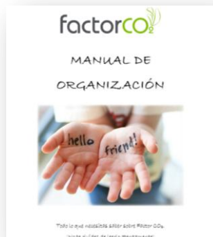
Ilustración 1: Portada del Manual de Organización elaborado por Factor CO 2