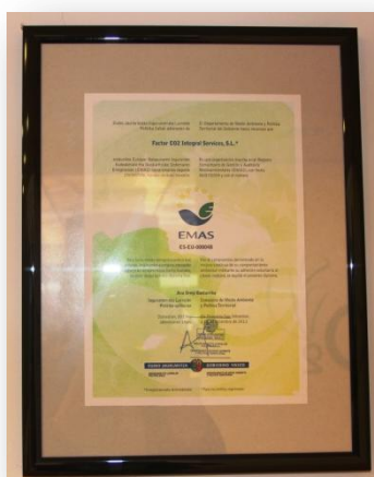
Ilustración 3: Certificado de inscripción en el Registro Comunitario de Gestión y Auditoría Medioambientales (EMAS)

Además, Factor CO 2 trabaja bajo un sistema de gestión de la calidad y gestión ambiental ISO 9001 e ISO 14001 y EMAS. Bajo el esquema del EMAS, o Sistema Comunitario de Gestión y Auditoría Medioambientales, Factor CO 2 realiza, desde el año 2008, su Declaración Ambiental, reflejo de su responsabilidad con el entorno sin dejar a un lado la calidad de sus servicios, que puede solicitarse públicamente a través de la página web o el contacto facilitado por la organización.