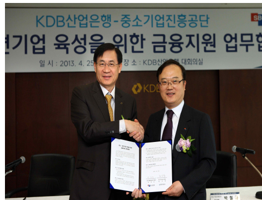
중소기업 금융지원 업무협약