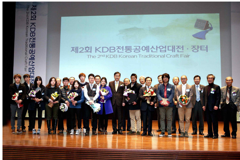
KDB 전통공예산업대전 시상식

전통공예산업 지원사업은 대부분 영세한 전통공예산업체의 자립기반 구축하여 산업의 육성 및 진흥을 도모하기 위해 진행한 사업입니다. 2013년에「제2회 KDB 전통공예산업대전·장터」를 개최하여 총169명의 수상자에게 180백만원의 상금을 지급하였습니다. 현장판매를 지원하는데 그치지 않고 수상작품 게재 도록과 출품작 전체 게재 카탈로그 홍보물을 제작·배포하여 지속적인 판로 개척을 지원하고 있습니다. KDB 나눔재단은 이러한 지원들을 통해 전통문화산업을 보다 대중화하고, 다른 산업에 비해 상대적으로 침체되어 있는 전통문화업계에 활력을 불어 넣을 수 있을 것으로 기대하고 있습니다.