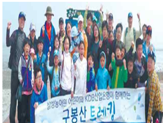
KDB 산업은행 사회공헌단