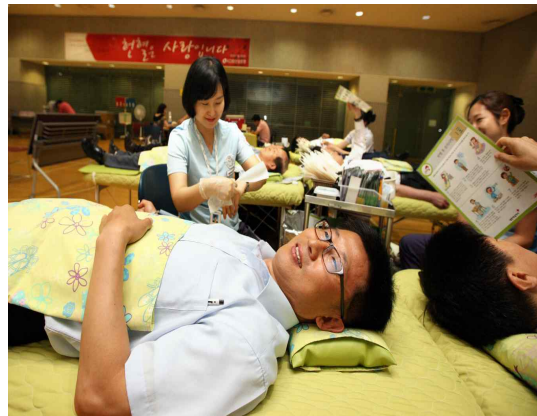
산은가족 헌혈 캠페인