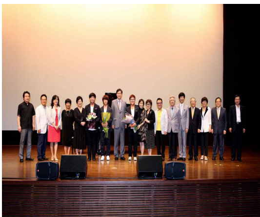
음악재능인재 재능기부 콘서트

또한 “건강한 신체를 통해 건전한 사회”만들기의 일환으로 많은 시민들이 참여하고 있는 대중스포츠인 마라톤을 장려하기 위하여 춘천마라톤대회, 손기정 평화마라톤기념대회 등에도 협찬을 통해 참여하고 있고, 향후 스포츠 분야의 후원을 확대해 나갈 계획입니다.