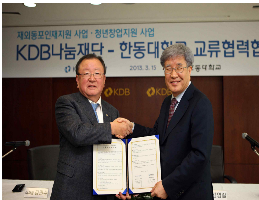
재외동포 인재지원 사업