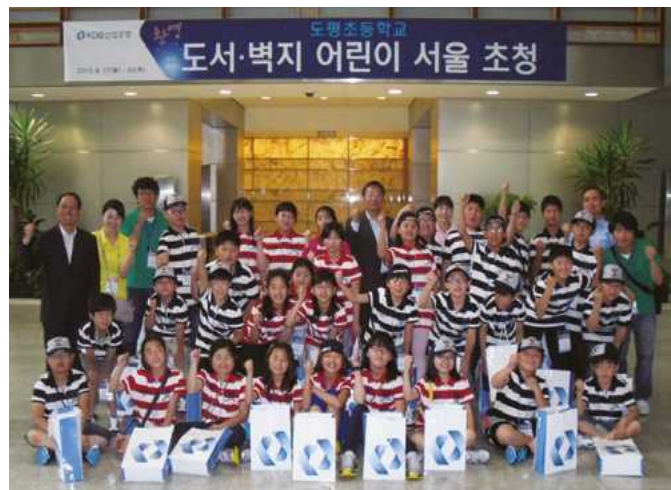
도서, 벽지 어린이 서울초청

이 외에도 KDB 산업은행은 한국재무학회나 한국경제학회, 한국증권학회 등의 금융·경제 관련 각종 학술단체에도 한국경제와 금융산업 발전의 이론적 토대 구축이라는 차원에서 꾸준히 지원하고 있습니다.