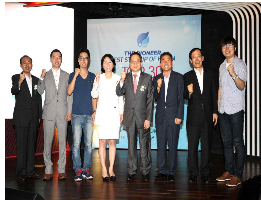
청년 창업 경진대회 개최