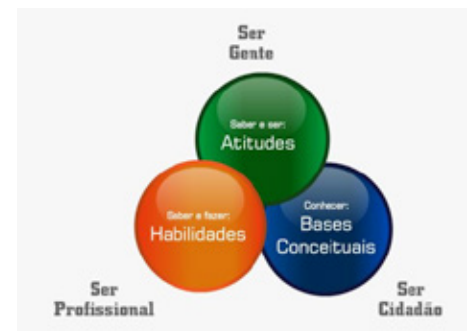
Imagem – Fonte: Projeto Pescar

O “ser cidadão” é trabalhado ao longo do curso atuando com temas como o conflito de gerações, empatia e principalmente o relacionamento e as diferenças.