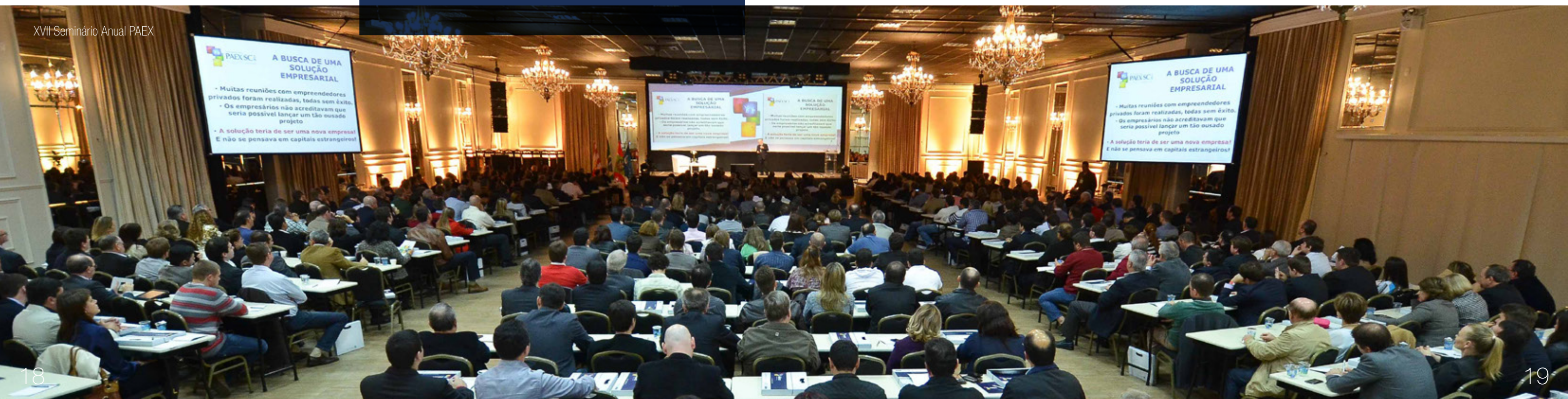
XVII Seminário Anual PAEX

Em 2013 a FFM realizou a 3ª turma da especialização em Gestão de Negócios no estado de SC. A estrutura curricular visa ampliar a base de conhecimento dos participantes, contribuindo para o seu aprimoramento profissional e sua preparação para novos desafios no mundo corporativo.