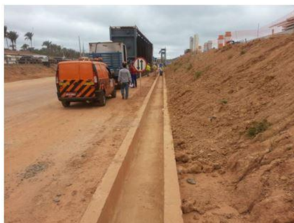
Figura 10. Limpieza de los canales de drenaje