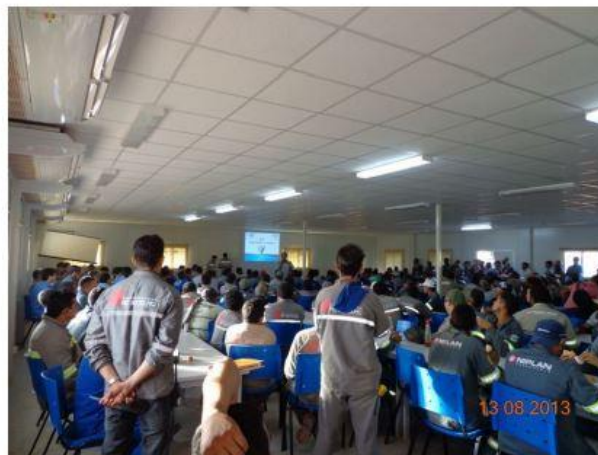
Figura 9. Curso Orden y limpieza en la Obra

En obra el respeto hacia el medioambiente es un factor de gran importancia, las actividades deben cumplir siempre con la legislación aplicable y con el plan de vigilancia ambiental establecido por la Organización. Algunas de las acciones que se llevan a cabo en Obra como medidas de protección ambiental son: