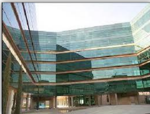
SEDE CENTRAL INITEC ENERGÍA MADRID