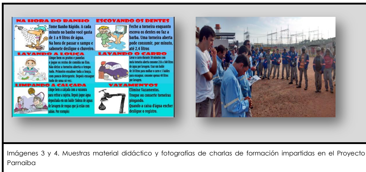
Imágenes 3 y 4. Muestras material didáctico y fotografías de charlas de formación impartidas en el Proyecto Parnaíba

Para este mismo proyecto, cabe destacar la formación llevada a cabo en materia de Seguridad Vial, Gestión de Residuos, y Medioambiente.