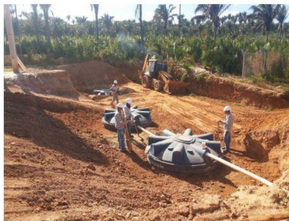
Imagen 13. Mantenimiento de los sistemas

En las obras en curso se realizan simulacros de emergencia ambiental, en los que se ponen en práctica las medidas correctivas a realizar en caso de accidente medioambiental. Entre estas acciones se encuentra entre otros los casos de vertidos de combustible. Estos simulacros están enfocados a la prevención de afecciones al medio ambiente.