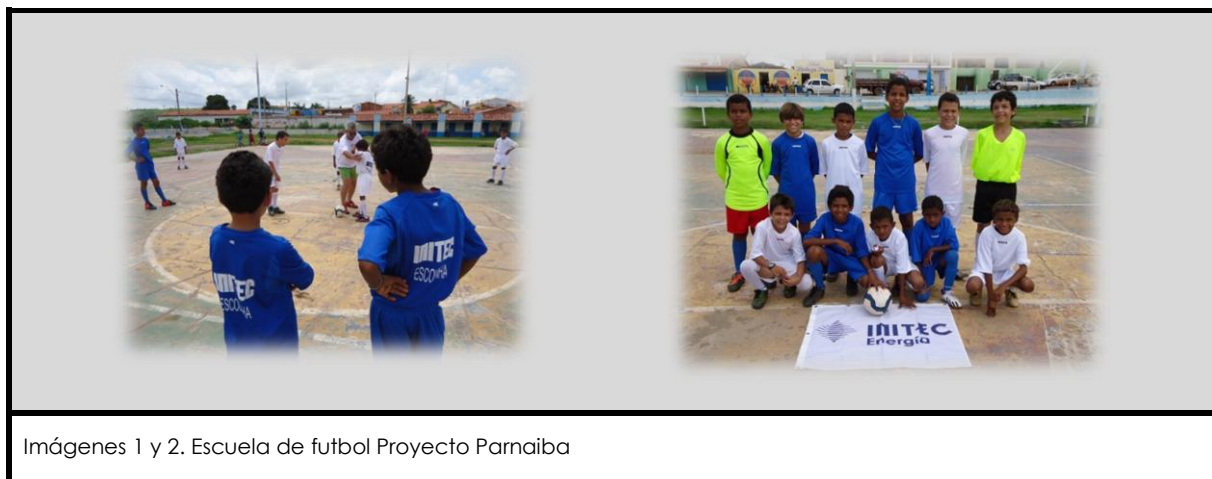
Imágenes 1 y 2. Escuela de futbol Proyecto Parnaíba

A través del deporte, los niños desarrollan habilidades y destrezas personales como el trabajo en equipo, el compañerismo, la responsabilidad y el respeto mutuo. La escuela de fútbol está ligada al colegio donde están escolarizados los niños de manera que se promueve un adecuado uso del tiempo libre así como la formación y el estudio de los pequeños en sus centros.