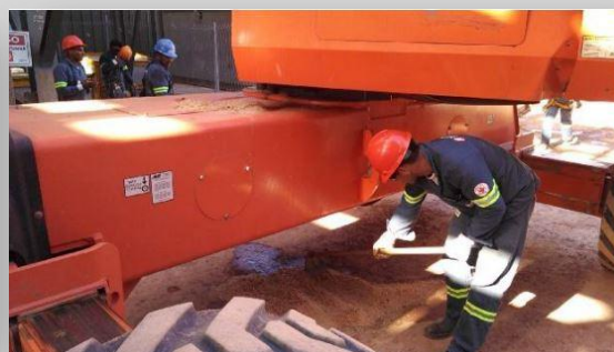
Imagen 14. Simulacro de accidente ambiental. Derrame. Proyecto Parnaíba

En todas las actividades de INITEC Energía se busca el mayor respeto hacia el medioambiente, condenando aquellas prácticas que incumplan la Legislación o los requisitos establecidos para la protección del medio ambiente. La información relativa al porcentaje de recursos sobre el total de ingresos brutos, destinados a campañas de sensibilización y formación medioambiental queda recogida para el conjunto del grupo ACS, en la correspondiente Memoria anual.