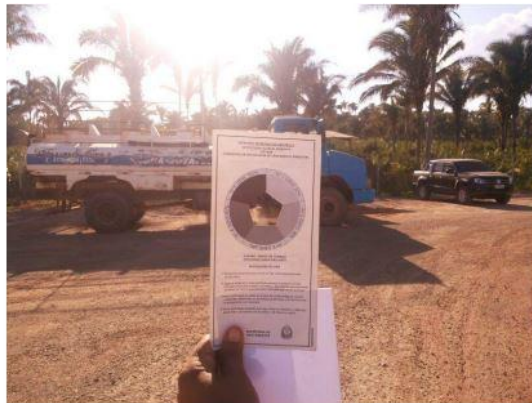
Figura 11. Medidas de contaminación atmosférica. (Medidor de partículas Hi-Vol)(Escala de Ringelmann)