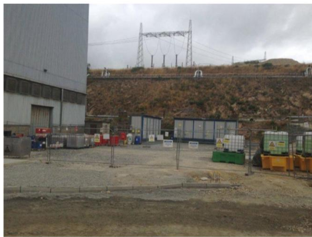
Imágenes 5 y 6. Contenedores de residuos y zona de almacenaje en el Proyecto Great Island