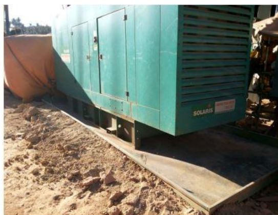
Imagen 12. Limpieza de las bandejas de drenaje