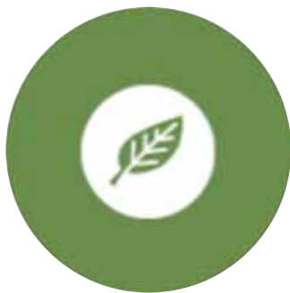
MEDIO AMBIENTE. 7, 8 y 9