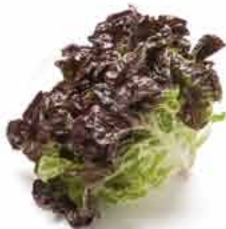
HOJA DE ROBLE