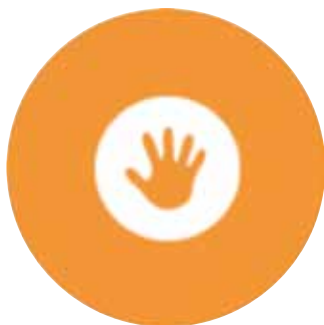
DERECHOS HUMANOS. 1 y 2