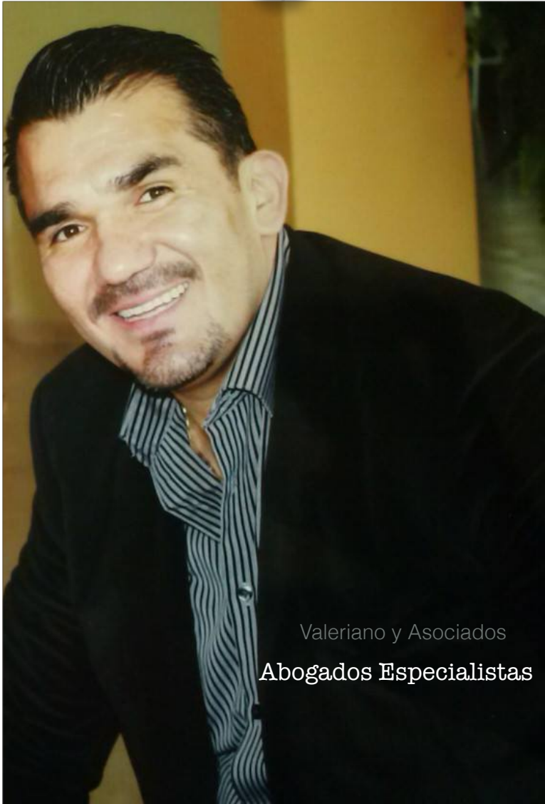
Valeriano y Asociados Abogados Especialistas

Medio Ambiente Derechos Humanos Derecho Laboral Anti - Corrupción