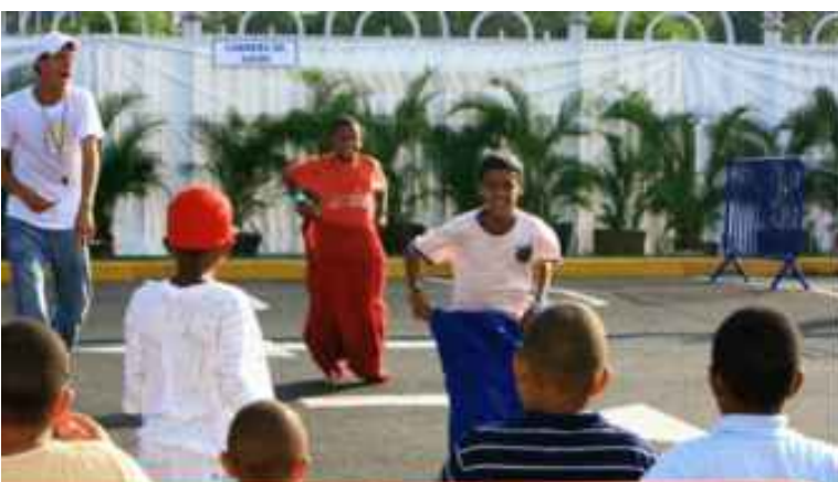
Imágenes de la pasada festividad de los Santos Reyes Mayos en el parqueo de la Torre Popular, con hijos de empleados del banco.