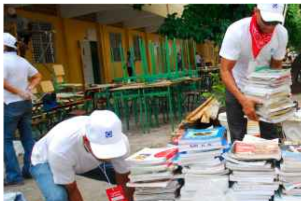
Personal del banco en el remozamiento de una escuela.

genera la confianza con la clientela, accionistas y empleados, debido al nivel de transparencia. El gobierno corporativo del Grupo popular ayuda a asegurar que la empresa toma en cuenta los intereses de un amplio rango de componentes.