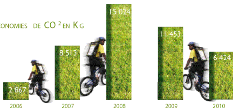
ÉCONOMIES DE CO 2 EN KG

À ce jour, vous êtes plus de 2280 clients « écolo », qui participez à nos côtés à la protection de la planète. Avec plus de 200 000 courses vertes réalisées et plus de 612 500 km parcourus depuis 2006, vous avez contribué à l'économie de plus de 42 tonnes de rejet de CO 2 , soit l'équivalent de plus de 75 tonnes de papier .