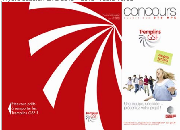
Flyers session BTS 2010 – 2012 - recto-verso