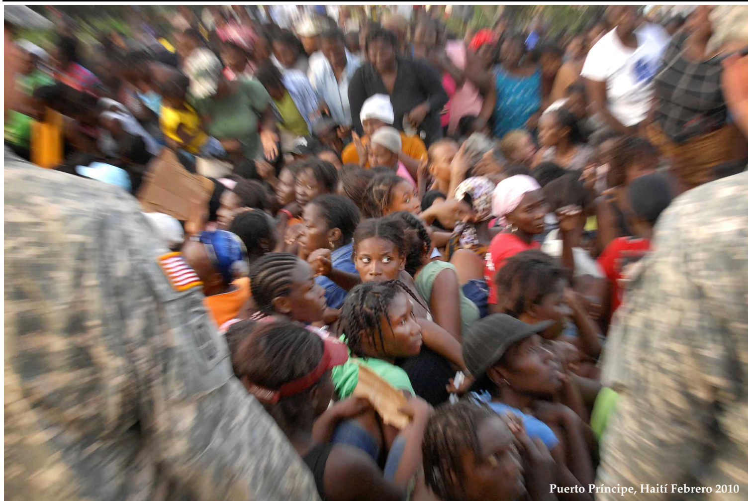
Puerto Príncipe, Haití Febrero 2010

Programa 2011 Firma del consejo y compromiso 2011 Página 7