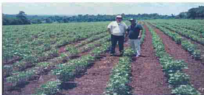
Acompañamiento a la investigación de la semilla REBA P279