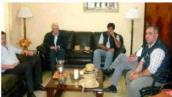
Reunión con Gobiernos Locales para lograr alianzas Agosto 2010