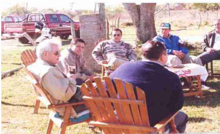
El directorio de MPSA realiza un recorrido periódico con cada uno de los comités de agricultores de los 110 agricultores. Foto del año 92

A continuación, presentamos las acciones realizadas desde el entonces hasta la fecha .