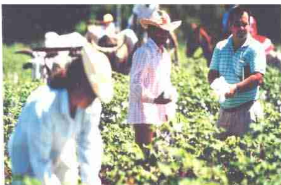
Acompañamiento en Finca Verificación de la primera cosecha. Foto año 1.994