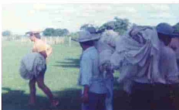
Entrega de insumos En la finca del agricultor (bolsones ) Foto año 1988