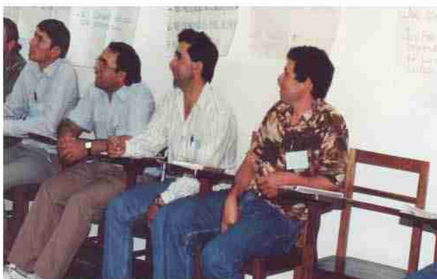
Actualización a los extensiones de la Gerencia de Zafra. Foto año 2.000.