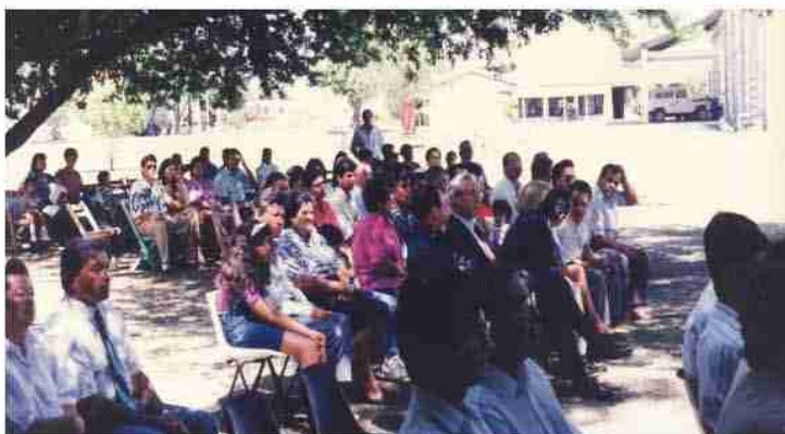
Reunión de Planificación de zafra Foto año 1.999