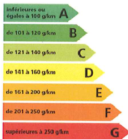
Etiquette-type d'émission de CO 2 des véhicules

Prise en compte du critère « véhicule propre » (taux de CO 2 ) dans les choix des voitures de société.