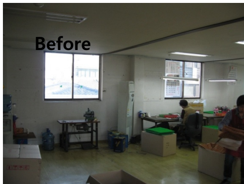
진래상사 (조명공사 + 환풍기 공사)

성주그룹은 창립 20주년을 맞아 성주그룹의 우수 협력업체를 선정하여 시설 보완 공사를 지원하여 업무에서 생길 수 있는 차별을 철폐했다. 이를 통해 성주그룹은 함께하는 행복한 사회를 이루고자 하는 성주그룹의 사회환원 의지를 표명하고, 열악한 업무환경에서 근무하는 임가공사 직원들에게 실질적 도움을 주고자 함. 각 업체별 평가 점수는 품질/납기상태/거래년수 등을 종합하여 평가하여 우선순위로 지원함. 총 10개 업체를 선정하여 지원함.