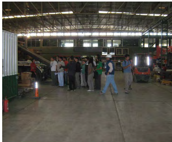
Los alumnos durante la visita guiada al almacén y Taller de Eco Minera S.A.