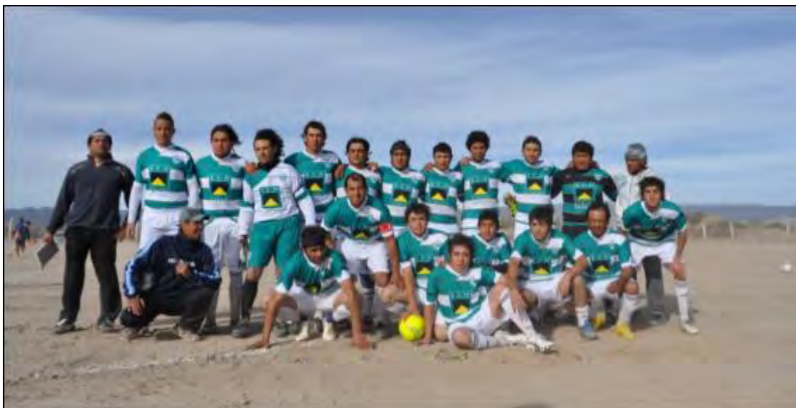
Integrantes del equipo de fútbol luciendo los uniformes sponsoreados por Eco Minera S.A.

Durante el año 2012, en forma conjunta con la Municipalidad de Iglesia de la Provincia de San Juan, sponsoreamos a un equipo de futbol de primera división de la comunidad.