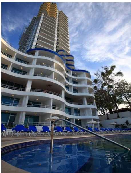
Solarium Coronado Beach