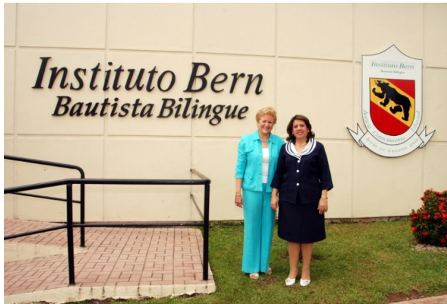
INSTITUTO BERN VALLE DORADO, LA CHORRERA