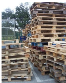
Stockage des palettes abîmées

Depuis 2003, nous récupérons le verre. Ceci consiste principalement en des verrines non commercialisées, préalablement vidées. En 2009, la Communauté des Commune du Haut Pays Bigouden a enlevé 720 kg de verre. En 2008, la quantité collectée était de 1.46 tonnes. Cette chute s'explique par une production de verrines plus faible sur l'année 2009 d'une part et une amélioration du process avec moins de déclassé d'autre part.