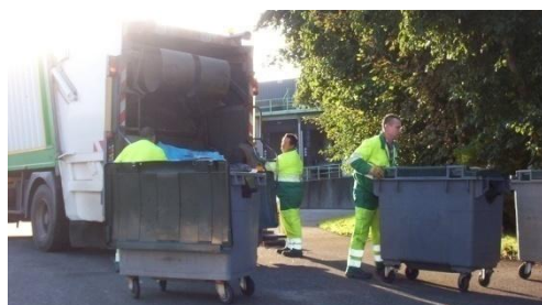
Ramassage des déchets non recyclables