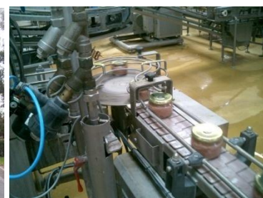
Chaîne de conditionnement en verrine