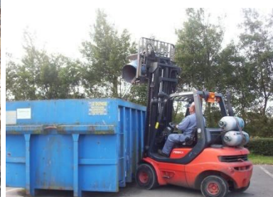
Benne de collecte des métaux