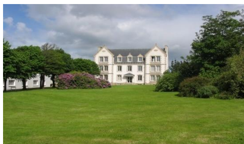
Parc autour de l'usine et des bureaux commerciaux