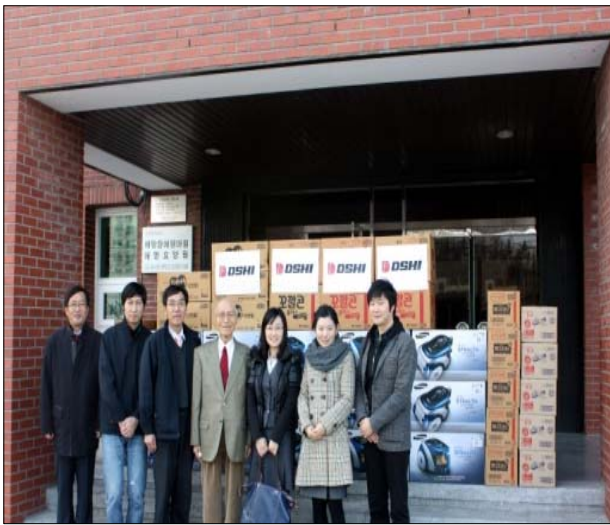
<애망원 방문 활동>

애망원의 몸이 불편한 아이들이 좀 더 나은 환경에서 지낼 수 있도록 지원하고 있으며, 그 외 어린이재단 등의 단체에 기부활동을 하고 있습니다. 소외된 이웃들에게 당사의 기부활동이 도움이 될 수 있도록 앞으로도 인권 보호에 힘 쓰도록 하겠습니다.