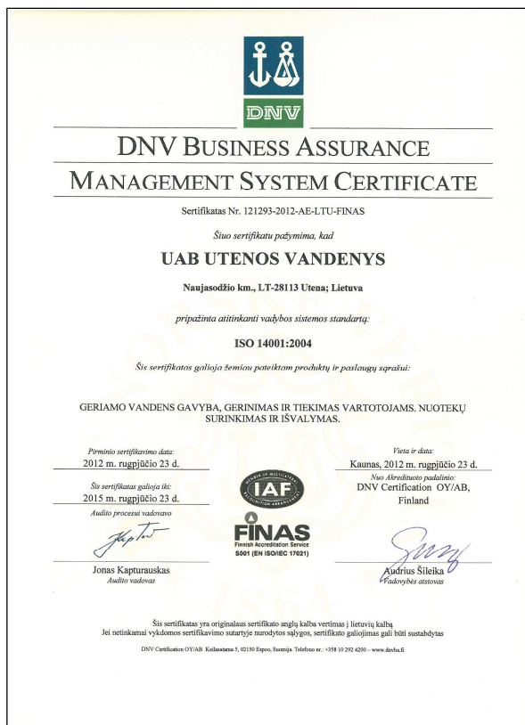
2 pav. Sertifikatai patvirtinantys UAB „Utenos vandens“ integruotos vadybos sistemos atitikimą standartams LST EN ISO 9001:2008 ir LST EN ISO 14001:2005

Ataskaitiniais metais atliktas vidaus auditas įmonės procesų atitikties ISO 14001 ir ISO 9001 reikalavimams vertinimas, radus neatitikimus, papildytos ir patobulintos integruotos vadybos sistemos procedūros.