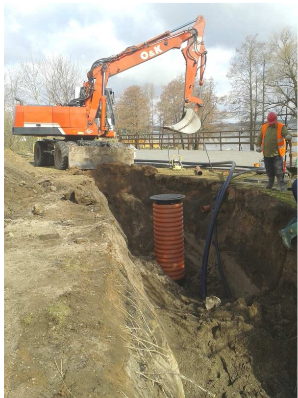
1 pav. Tinklų statybos darbai

Ataskaitiniais metais vandens tiekimo ir nuotekų surinkimo tinklai buvo statomi Grybelių, Šilinės kaimuose, Sudeikių, Užpalių, Vyžuonų miesteliuose. Ataskaitinių metų rudenį pradėti statyti nuotekų tinklai Tauragnuose. 2013 metais pagal plėtros projektą pastatyta 21,4 km vandentiekio ir 23,3 km nuotekų tinklų už 19,9 mln. Lt.