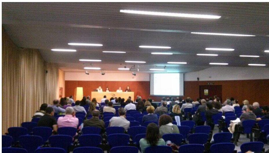
Jornada “Menos ruido, más acústica” Terrassa (Barcelona)

Día Internacional de Sensibilización hacia el ruido 2014