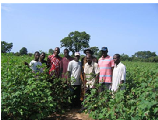
Rencontre avec les producteurs

L'audit a regroupé différents acteurs : 3 personnes de Max Havelaar, 1 personne représentant le fournisseur tissu avec lequel nous travaillons pour notre offre coton équitable, 4 clients (secteur chimie, traitement des déchets, collectivité, blanchisseur) et la direction du groupe.