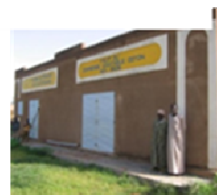
Magasin de stockage