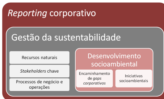
Figura 1 - Framework de atuação da Via Gutenberg ambiente. Desde 2009, a empresa é signatária do Pacto Global, e vem incentivando que seus parceiros de negócios compartilhem dos mesmos princípios.

A Via Gutenberg gerencia e implementa, na prática, os conceitos de desenvolvimento sustentável e de responsabilidade social corporativa, fazendo com que eles se concretizem em iniciativas com resultados mensuráveis para os negócios, a sociedade e o meio