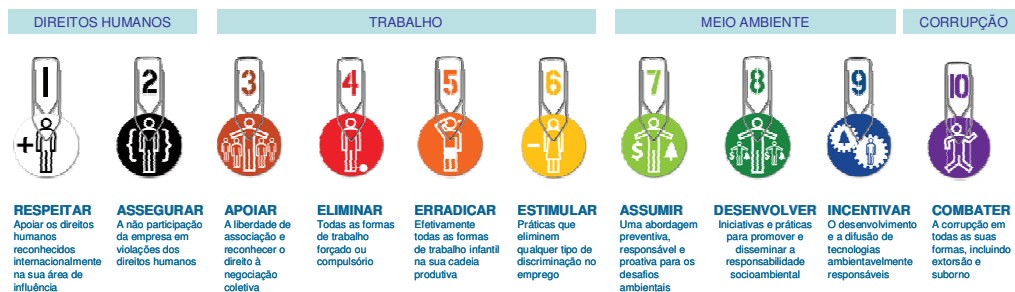
Figura 3 - Princípios do Pacto Global

O desenvolvimento sustentável faz parte do core business da Via Gutenberg, e com isso o compromisso para sua aplicação inicia-se “dentro de casa”, a partir do respeito a todas as pessoas com as quais nos relacionamos, visando à construção e manutenção de um relacionamento equilibrado, transparente e honesto.