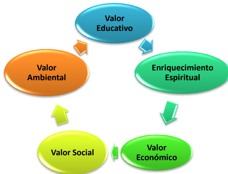
Ejes u Objetivos Estratégicos Orientación de cada eje de valor

A partir de este ejercicio ha definido cinco ejes u objetivos estratégicos de valor para el desarrollo de sus actividades institucionales, como se puede apreciar seguidamente: