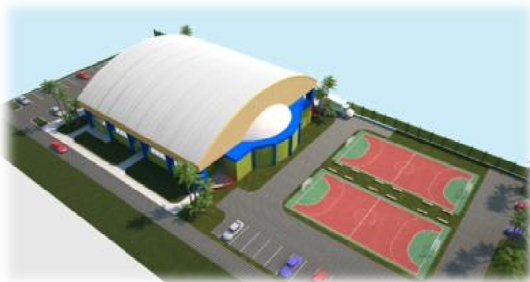
Vista del nuevo Complejo Deportivo St. Jude School

A la vez solicita a sus proveedores y sub-contratistas mantenerse al día con estos principios. Es importante destacar que si cualquier de ellos, incumple con alguno de ellos, de inmediato deja de ser parte de la institución.