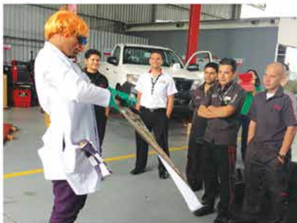
Taller de Súper Accesorios en Ciudad Toyota