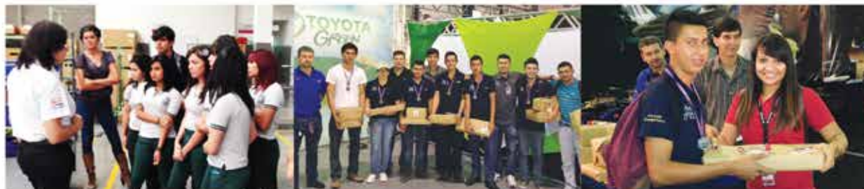
Visita de estudiantes de Liceo Julio Fonseca