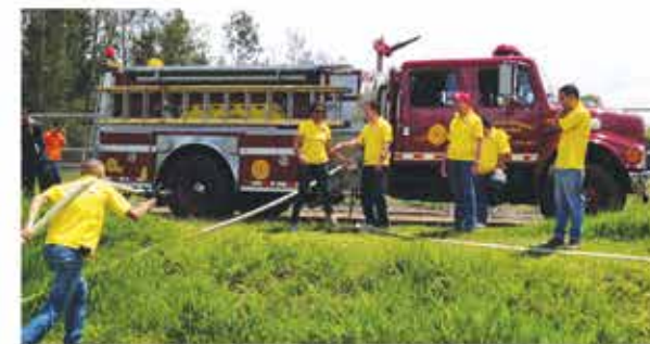
Primer Encuentro Nacional de Brigadistas

Adicionalmente, nuestros talleres están certificados por TSM KODAWARI de Toyota Motor Corporation (TMC), lo que garantiza que cumplimos con los estándares de operación y de instalaciones requeridos por parte de TMC, cuyo objetivo es brindar un excelente servicio al cliente y alcanzar la calidad y mejora continua en las operaciones.