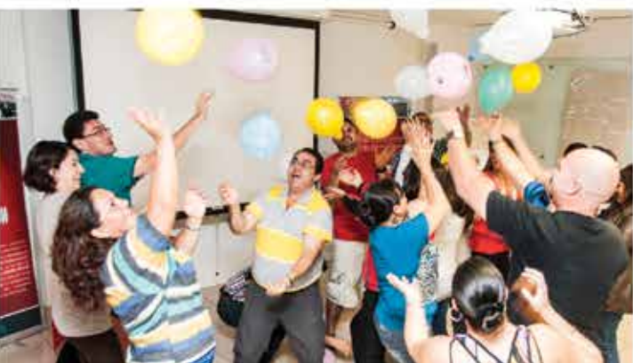
Actividad realizada durante el Taller de la Hormiga