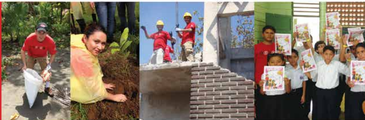
Actividades de voluntariado: Limpieza de playa Matapalo, siembra de árboles, Parque Nacional Santa Rosa y educación vial.

A lo largo del 2013, recibimos 45 practicantes de nivel técnico y 3 de nivel universitario.