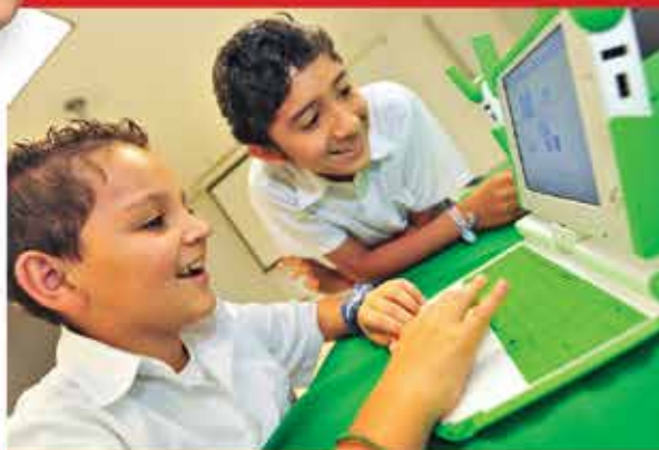
Niños con las computadoras XO entregadas por La Fundación Quirós Tanzi

Para mayor información visitar: www.fundaciongente.org www.facebook.com/FundacionGenteCostaRica