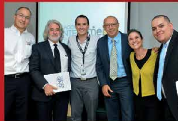
Firma del convenio Fundación Gente y MEP