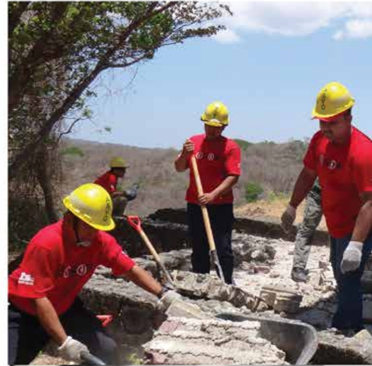
Voluntariado Parque Nacional Santa Rosa