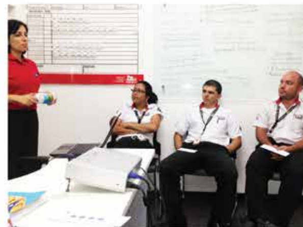
Sucursal de San Carlos