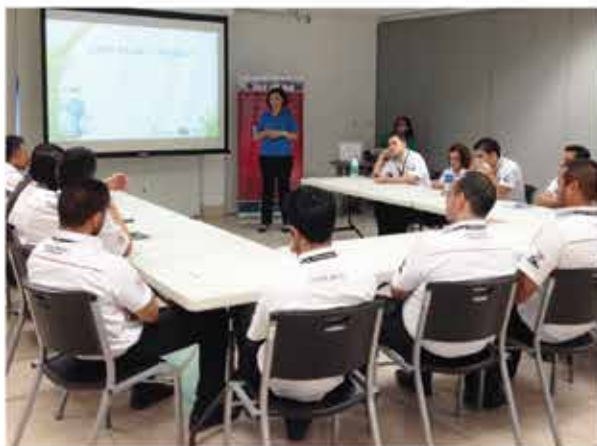
Educación Ambiental 2013: Ciudad Toyota

Además de generar conciencia en la Gente Purdy y en el trabajo que realizamos dentro de la empresa, buscamos que cada uno pueda llevar este conocimiento a sus hogares y con esto, crear un efecto multiplicador de buenas prácticas.