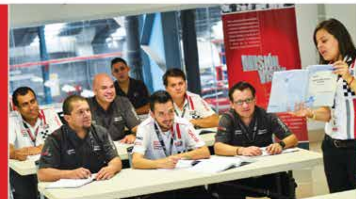
Tutoría de estudiantes de Purdy Cole