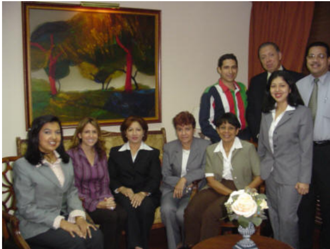
□ Comité de Voluntariado Corporativo de Morgan & Morgan