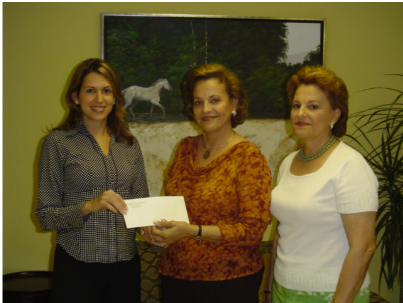
□ Donación a Fundación San Felipe.

“Cuánto más alto estemos situados, más humildes debemos ser”. Marco Tulio Cicerón