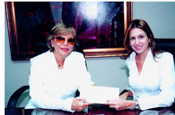
□ Donación a Nutre Hogar.