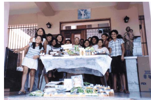
□ Donación a Hogar de Nuestra Señora.