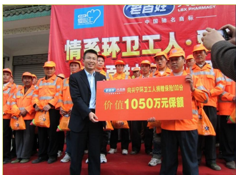
图 16 广西公司为环卫工人捐赠人身意外伤害保险

2013年12月25日，老百姓大药房向环卫工人赠送包括防尘防霾口罩、清肺药、护手霜在内的防雾霾药包近2000份，总价值近6万元，为这群最受雾霾“侵害”的人群送来今冬最强的一层防护。