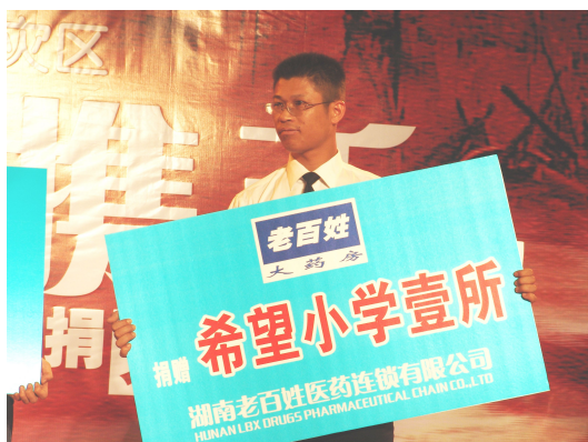
图 4 老百姓大药房捐赠希望小学一所

2008 年 6 月，陕西公司现场认购义卖茶叶 100 盒，为灾区孩子筹集善款 1 万元；