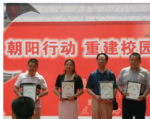
图 5 爱心茶叶义卖，老百姓大药房认购 1 万元

2011 年 7 月，为北京“天使之家”的孩子们送去一批常备药品。爱心让孩子们在酷暑感受到一丝清凉。