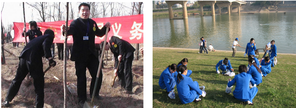
图1 植树造林、城市环卫，老百姓大药房积极履行对生态环境的职责

保护生态环境，促进人与自然的和谐相处，老百姓大药房一直积极参与。如陕西公司开展的“拯救森林·筷行动”，免费向消费者赠送携带方便、健康环保的不锈钢筷子，号召消费者抵制一次性筷子；湖南公司免费向消费者赠送树苗，号召大家一起绿化环境，优化自然生态；天津公司组织为天津河北区北宁动物园捐款，呼吁广大市民爱惜动物，对生态环境予以关注等。老百姓大药房希望通过自己的行动，号召更多的人履行对生态环境的职责，为子孙后代创造良好的生存环境。