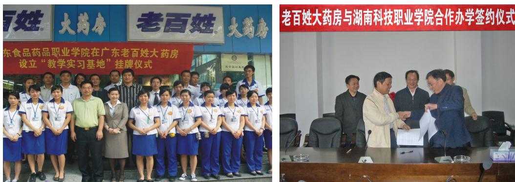
图 10 老百姓大药房与多所学校合作成立教学实习基地，共同合作办学，吸纳学生实习就业

2011 年 1 月 11 日，共青团湖南省委邀请了部分在湘的全国人大代表、全国政协委员、省人大代表、省政协委员以及新生代农民工代表共 50 余人，在老百姓大药房会议厅开展面对面沟通交流活动，探讨并了解新生代农民工的诉求，热议新生代农民工融入社会的问题。