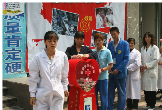
图9 抗震救灾“老百姓”积极参与救灾行动

2010年4月，青海玉树地震发生后，老百姓大药房伸出援手，第一时间向灾区捐赠价值100万元的外伤和常备用药。