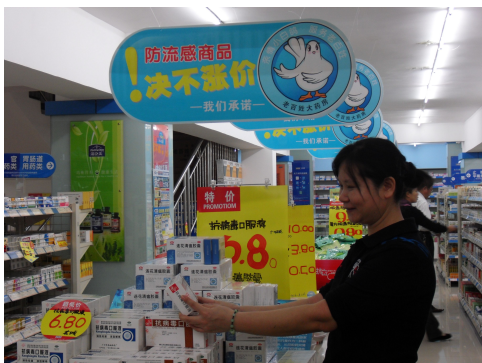
图 13 流感期间，抗流感药品绝不涨价