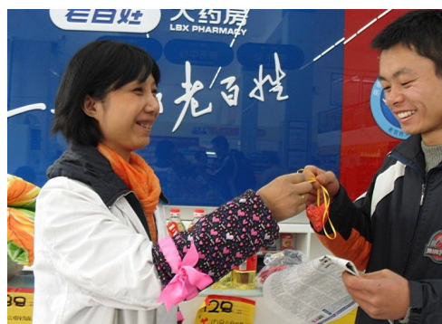
图 14 门店药师为公交司机送上防流感香囊

2009 年 10 月 27 日，老百姓大药房在湖南长沙发起成立了“老百姓爱心汇”公益组织，成为我国第一个自发进行造血干细胞知识宣传的药品零售企业。当天活动现场，由“老百姓爱心汇”发起的“义卖大比拼”和“造血干细胞志愿捐献”活动同期进行，老百姓大药房董事长谢子龙和公司其他 50 多名志愿者与现场群众一道加入了造血干细胞捐献者行列，很多员工更是在采集血样后现场献血。“老百姓爱心汇”成立后，每年将组织全国 600 多家门店开展 6000 多场爱心活动，并积极宣传造血干细胞捐赠活动。