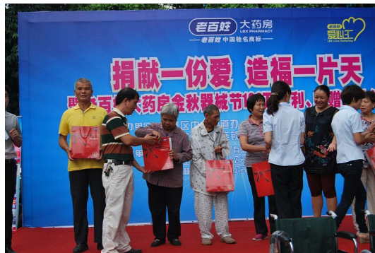
图 17 广西公司向福利敬老院捐赠爱心器械