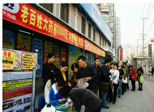
图 11 市民排着长队领取免费购药券

2009 年 3 月，即将成立的老百姓大药房江苏公司，在获悉受金融危机影响，很多低保户及下岗职工看病贵吃药难的情况后，立即与街道实行政企对接，开展了“55 万元帮扶 5500 户困难家庭”的爱心行动，赢得了社会的广泛好评。