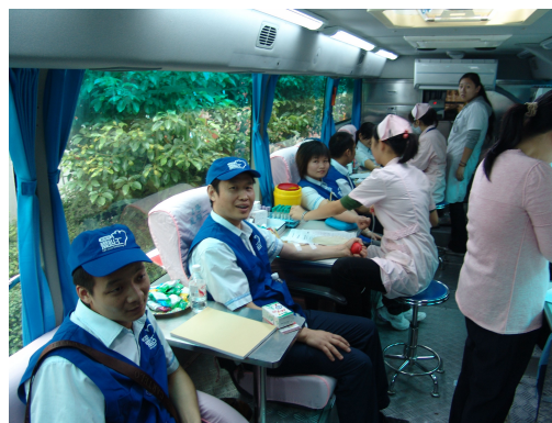
图 15 “老百姓”员工积极报名捐献造血干细胞

2010 年 10 月，老百姓大药房启动义卖大比拼活动，并向全国爱心捐赠 30 所中老年健康活动室，总价值 30 余万元。