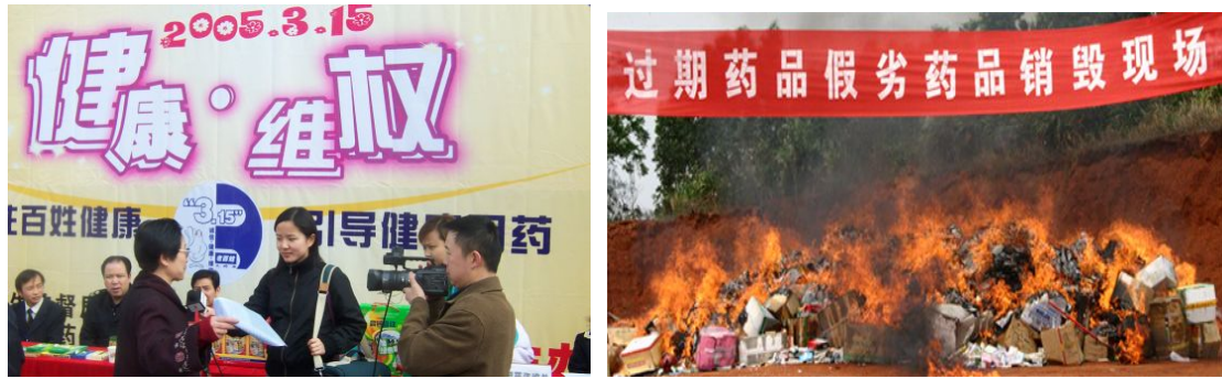
图2 过期药品回收及销毁大行动