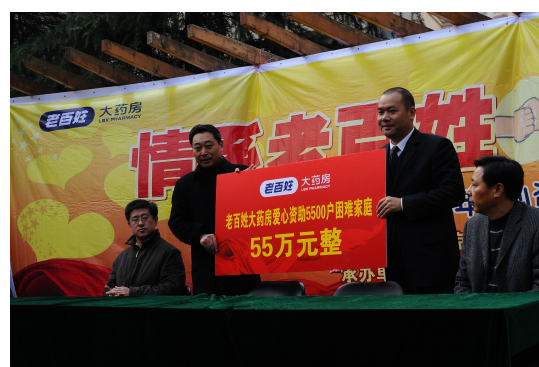
图 12 爱心资助 5500 户困难家庭捐赠现场

2009 年 4 月，流感快速传播，老百姓大药房立即在全国发起预防甲流系列活动——制作了 40 万份抗流感宣传页在全国门店免费派送，并为顾客免费派发中药凉茶、口罩、板蓝根等，制作了抗流感海报在门店及社区宣传栏进行张贴，提醒市民养成“勤洗手、多通风、少扎堆”的良好习惯，有效预防甲流传播。