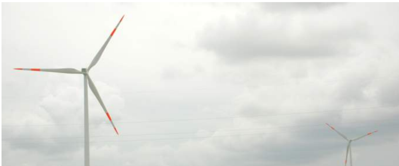
UAB „Renerga“ vėjo jėgainės Benaičiuose

Atsižvelgdama į paklausą, AB „Achema“ 2007 m. pradėjo AdBlue pramoninę gamybą. AdBlue vardu rinkoje vadinamas karbamido tirpalas naudojamas technologijoje, mažinančioje sunkvežimių taršą iki Europos Sąjungoje priimtinių standartų.