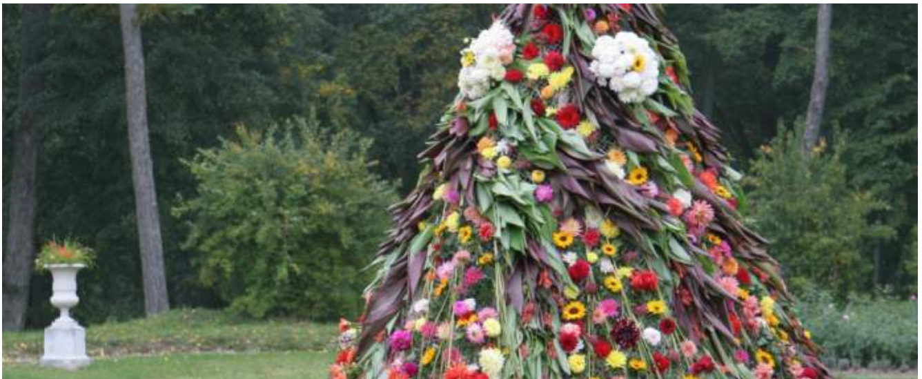
Iš „Žaliosios kartos“ padėkos renginio mokytojams. Užtrakio parkas

Remiamas ir mokslas: Vilniaus kolegijoje atidaryta „Achemos grupės“ lėšomis įrengta vardinė auditorija, Žemės ūkio universitete - „Agrochemos“ auditorija. KLASCO remia Klaipėdos universiteto informacinį centrą, kasmet skiria premijas mokslininkams bei menininkams.