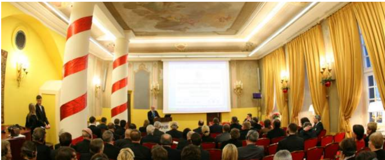
Konferencija „Pramonės dialogas su aplinka: kaip suderinti konkurencingumą ir rūpestį aplinka?“

Konferencijoje diskutavo bendrovių vadovai bei aplinkosaugos specialistai, valstybės politiką formuojantys pareigūnai bei diplomatai, nevyriausybinių organizacijų nariai.