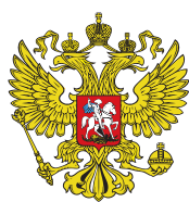
ПРАВИТЕЛЬСТВО Российской Федерации