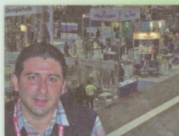
Participación en el Show ISSA, Chicago.