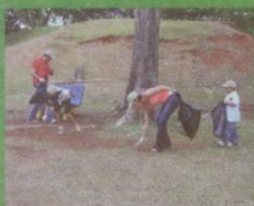
Jornada de limpieza y reciclaje.

En el 2009 Lotus fue incluida como una de las 30 empresas visionarias en RSE de la Región, por la revista Mercados & Tendencias. De Panamá entraron en este lista Lotus y Unión Fenosa.