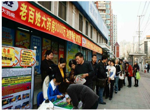
图 11 市民排着长队领取免费购药券