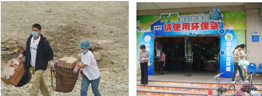
图3 宣传环保理念促进市民加强环保

2008年5月，老百姓大药房开展了“老百姓环保总动员”活动，向消费者免费发放环保袋近16万个，总价值达48万余元。同年，老百姓大药房浙江公司开展环保袋设计大赛，让市民在参与活动的同时熟知环保知识，实践环保行动，传播环保理念。除此以外，各省公司门店也充分利用卖场终端的优势，向顾客宣传环保理念，开展系列环保活动，来带动顾客参与环保。而且，省公司经常性地组织员工清扫街道，打扫社区公共卫生、开展社区公益演出等形式来加强城市文明建设。