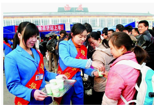
图8 寒风中送温暖，流动在各大车站的老百姓人

2008年5月，汶川地震发生后，老百姓大药房董事长谢子龙紧急中断在外地的商务活动连夜赶回长沙总部，并在第一时间指示公司紧急调集价值500多万元的灾区急需药品，派出由公司专业医护人员组成的“青年志愿者救护队”，护送急需药品奔赴灾区一线参与救援。同期，由公司董事长带头的捐款活动纷纷在总部及各省公司开展，集团共向灾区捐款116万余元。在公司内部，也紧急启动了“老百姓大药房千万困难救助基金”，帮助四川、陕西籍受灾员工渡过难关。