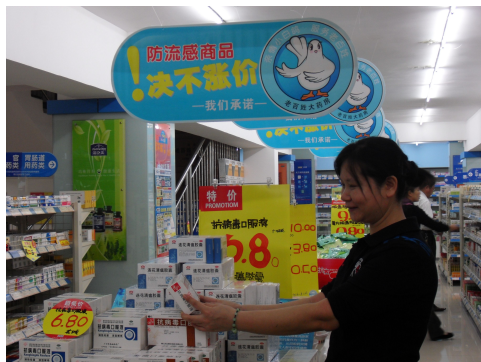
图 13 流感期间，抗流感药品绝不涨价

2009 年 11 月，老百姓大药房整合全国 14 个省市资源，开展了向的士及公交车免费赠送 200 万个中药香囊的大型公益活动，以此来预防流感在人口流动比较频繁的的士或公交车上进行传播。