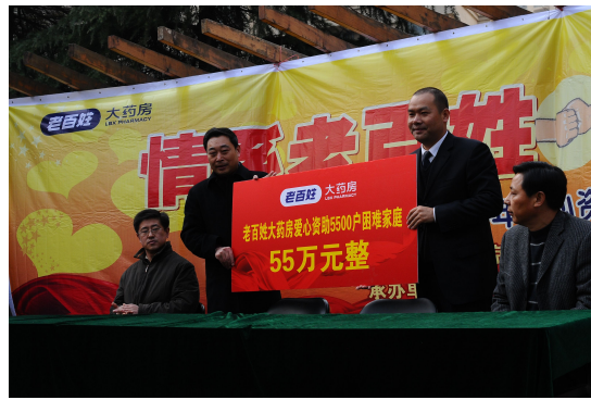
图 12 爱心资助 5500 户困难家庭捐赠现场

2009 年 4 月，流感快速传播，老百姓大药房立即在全国发起预防甲流系列活动——制作了 40 万份抗流感宣传页在全国门店免费派送，并为顾客免费派发中药凉茶、口罩、板蓝根等，制作了抗流感海报在门店及社区宣传栏进行张贴，提醒市民养成“勤洗手、多通风、少扎堆”的良好习惯，有效预防甲流传播。