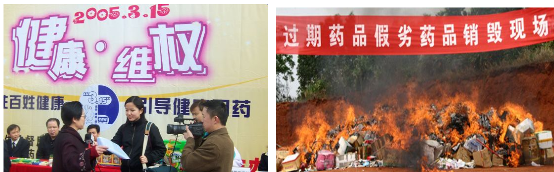
图2 过期药品回收及销毁大行动

另外，公司也经常通过晚会、活动、图片展等形式向消费者面对面地宣传节能环保知识和安全合理用药常识。例如，各省公司每年都开展的“过期药品回收”活动，为防止过期药品重新流入社会危害群众健康或因随意丢弃而污染环境，老百姓大药房每年都会投入大量资金，制作海报在门店和社区宣传栏进行张贴，号召市民合理购药以免浪费，并对过期药品进行回收，并根据药品价格水平兑换相应的礼品或现金券。公司每年都会回收上十吨的过期药品并联合各地政府监督部门一起进行销毁，每年投入到过期药兑换新药或现金券活动的费用就达 200 余万元。