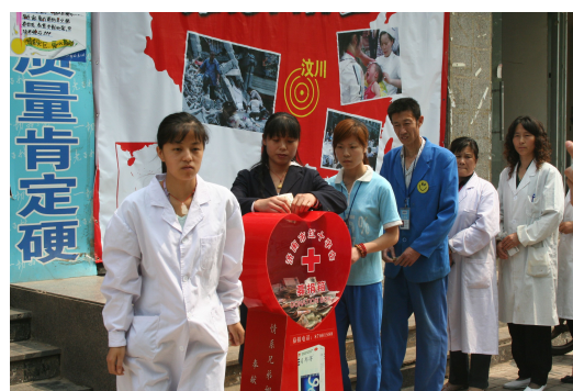
图9 抗震救灾“老百姓”积极参与救灾行动

2010年4月，青海玉树地震发生后，老百姓大药房伸出援手，第一时间向灾区捐赠价值100万元的外伤和常备用药。