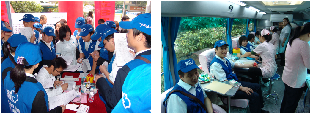
图 15 “老百姓”员工积极报名捐献造血干细胞

百姓爱心汇”成立后，每年将组织全国 600 多家门店开展 6000 多场爱心活动，并积极宣传造血干细胞捐赠活动。