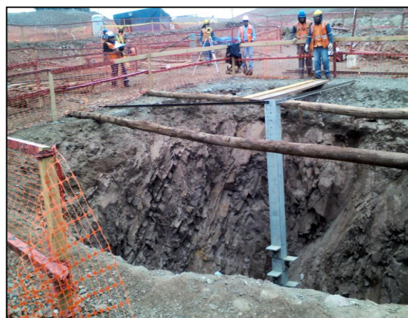
Obra: 220 kV. Pomacocha – Toromocho y LD 23 kV Toromocho – Kingsmill.

La empresa cuenta con un procedimiento denominado "Identificación, evaluación y control de