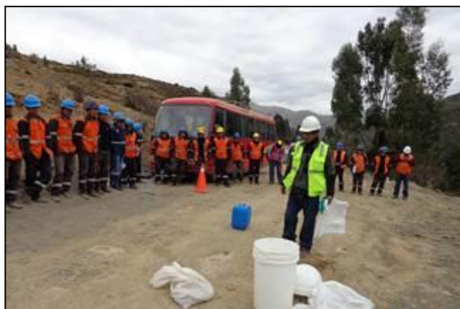
Simulacro de derrame de petróleo