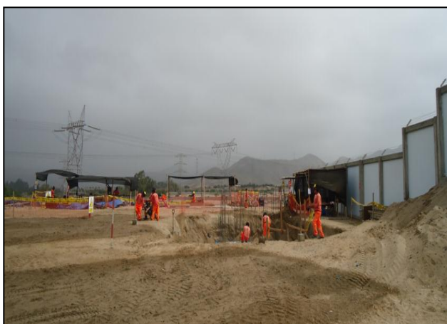
Obra: EPC 500 kV. Chilca y Montalvo y Subestaciones