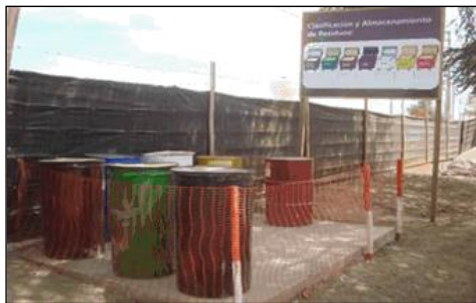
Segregación de residuos sólidos