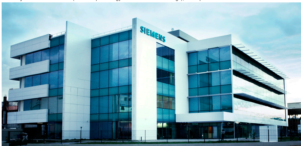
Fachada do novo prédio no parque tecnológico do Rio, que abrigará a sede da Chemtech

Essa consciência vem de dentro da empresa, começando na própria casa da Chemtech . O prédio que irá ocupar em 2014, dentro do Parque Tecnológico do Rio, na Ilha do Fundão (RJ), possui os mais altos padrões de segurança e certificação internacional LEED (Leadership in Energy and Environmental Design), de empreendimento sustentável.