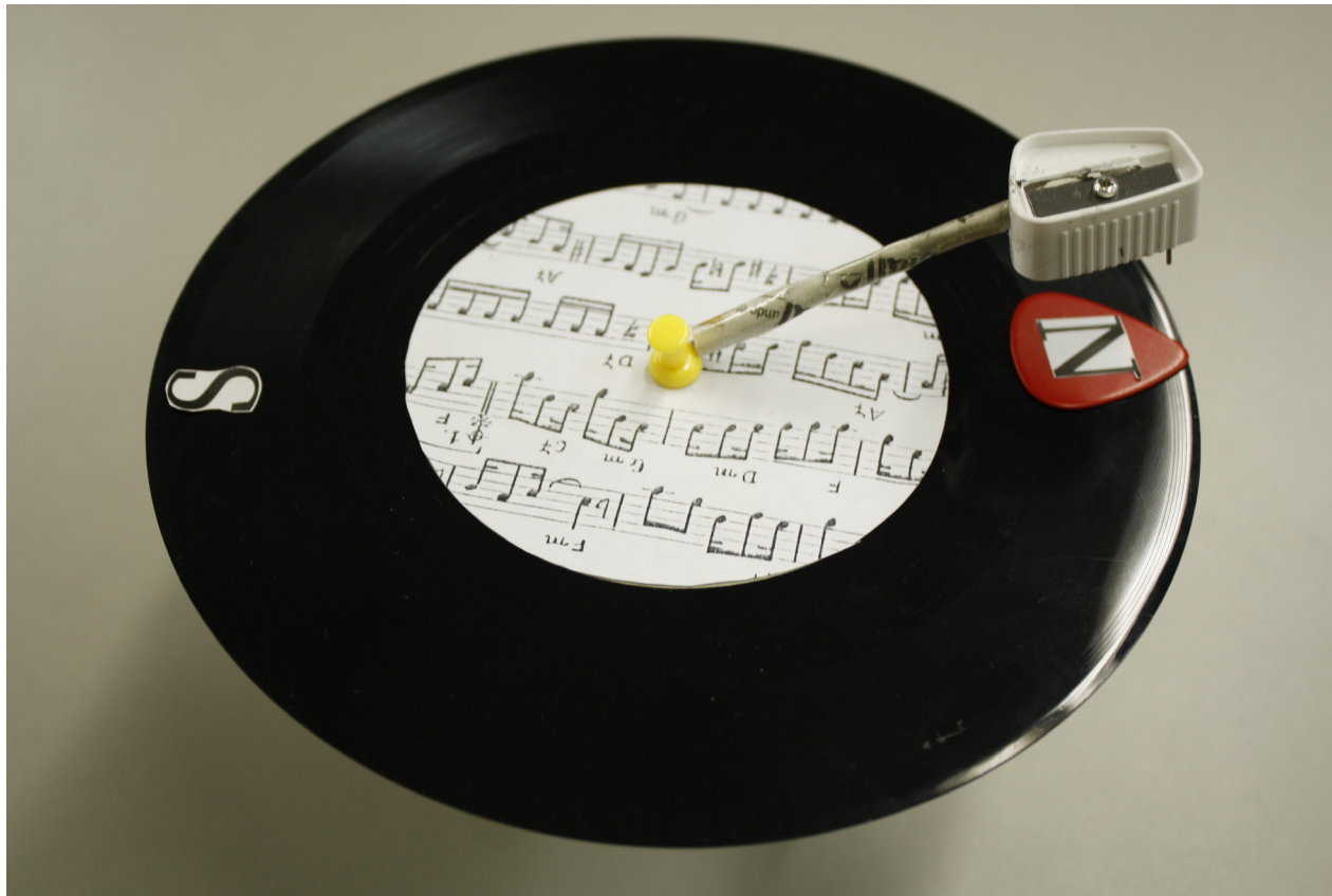
Bússola construída com materiais reaproveitados por uma das equipes participantes da Gincana de Compliance

Ao todo, os colaboradores cumpriram tarefas ligadas ao tema em cinco Missões, cada uma delas com diferentes regras e pontuações. A votação foi popular e cada colaborador teve a oportunidade de registrar seu voto em favor dos melhores resultados de cada etapa.