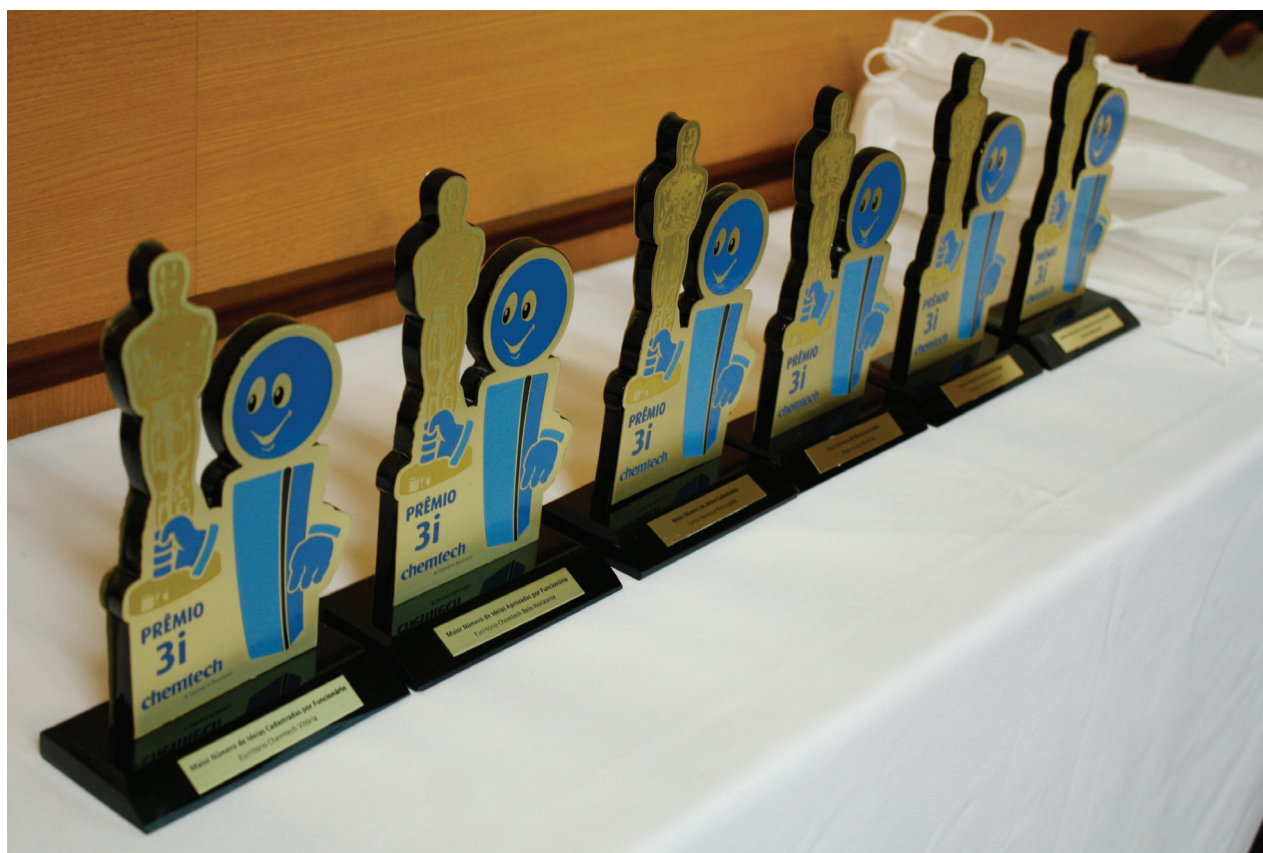
Troféu 3i conferido aos colaboradores e escritórios mais ativos no programa

A Chemtech está sempre investindo em formas de incentivo ao processo contínuo de melhoria e inovação. Atuando desta forma, a empresa espera que cada funcionário possa efetivamente influir nos rumos da Chemtech e contribuir para a história de sucesso da empresa.