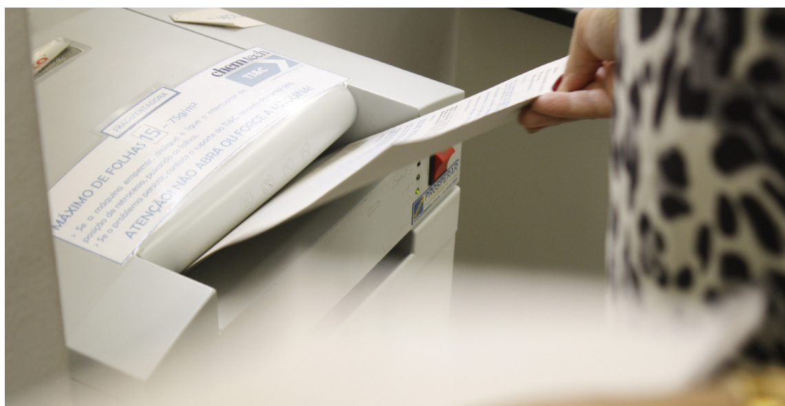
Descarte adequado de documentos durante ação de 5S em 2013

A conscientização envolve não apenas a destinação correta, mas também a temática de housekeeping , motivada pela mudança de sede da empresa em 2014. Ao longo de 2013, a Chemtech promoveu três campanhas de 5S, ação de melhoria baseada nos pilares descarte, arrumação, limpeza, saúde e disciplina. Quase 2 toneladas de materiais que não eram mais utilizados foram descartados nessas ações.