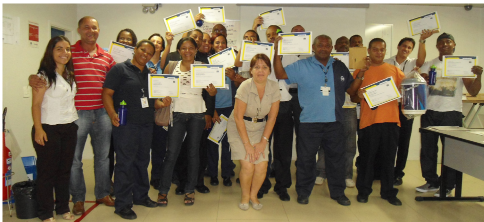
Formatura dos alunos do Projeto Polegar