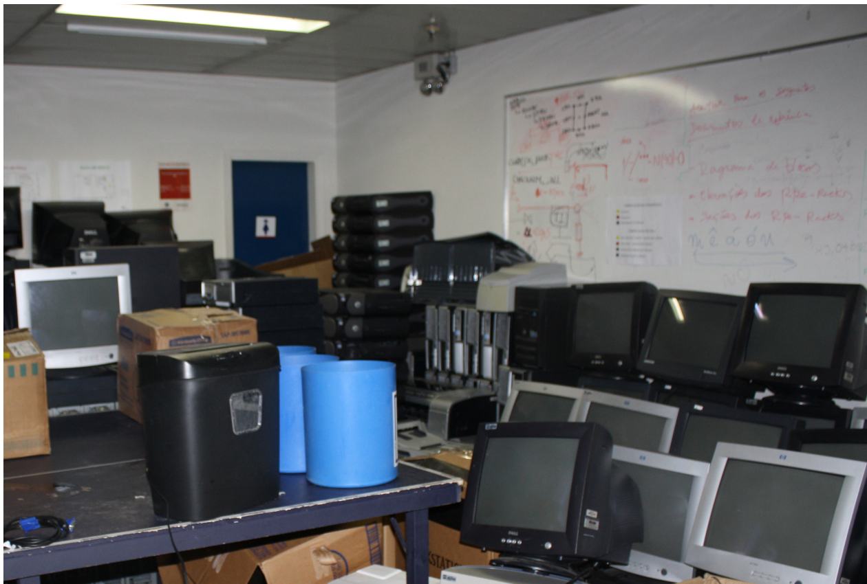
Equipamento doado ao CDI: duas toneladas de material eletrônico