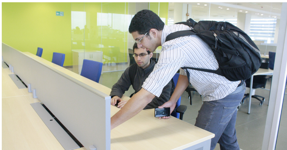
Prédio que abrigará a sede da Chemtech possui certificação LEED

As estratégias aplicadas na construção envolvem a seleção de equipamentos hidrossanitários com baixo consumo de água e captação da água da chuva. Além disso, o prédio terá equipamentos e sistemas com desempenho superior aos tradicionais, com uma edificação projetada para minimizar o impacto solar no edifício, de maneira a reduzir o consumo energético com ar-condicionado. O projeto de luminotécnica foi concebido para minimizar a utilização da iluminação artificial, com controles automáticos de ligamento e desligamento, além de potência de consumo reduzida.