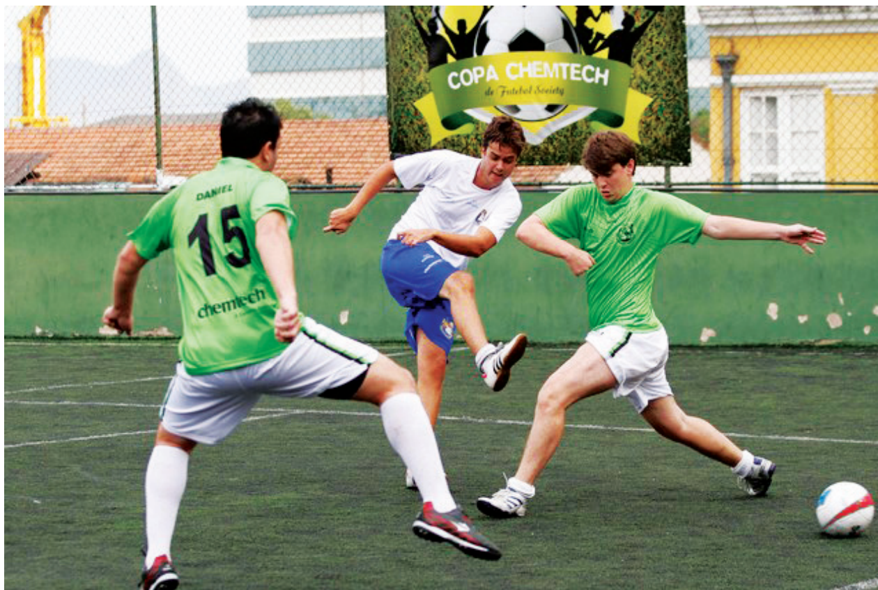
Copa Chemtech de futebol promove integração dos colaboradores