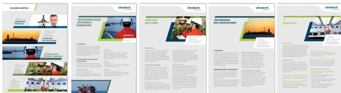
Material gráfico elaborado para reestruturação do portfólio da Chemtech

As cinco linhas de negócios atuais são estruturas catalisadoras de negócios, organizadas com o objetivo de aproximar a empresa das necessidades do mercado e apresentar suas soluções de maneira aderente, zelando sempre pela constante diferenciação e valorização da empresa.