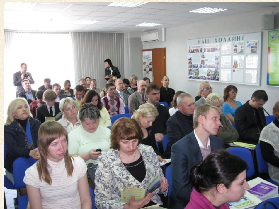
Третье Общее собрание Локальной сети Глобального договора (ЛСГД) состоялось на предприятии «Белинтертранс» 4 июня 2009 г.