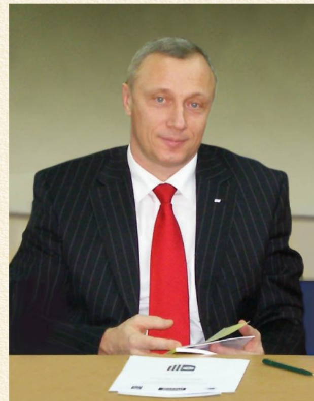
Генеральный директор ООО «Белинтертранс»

Сегодня мы представляем первый публичный отчет, отражающий активную социальную позицию нашего предприятия и подтверждающий наши намерения и в дальнейшем следовать принципам Глобального Договора.