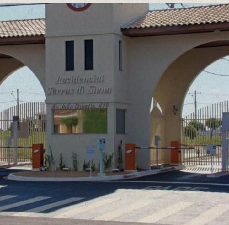
Portaria - Residencial Terras di Siena, Santa Bárbara d'Oeste-SP

Assumimos a responsabilidade de transformar uma propriedade em um empreendimento bem administrado, tendo como meta a “qualidade de vida urbana” em comunidades planejadas, para que se possa residir bem.