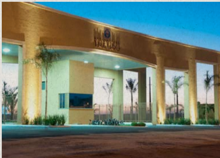
Portaria - Residencial Treviso, Cascavel-PR

A Newland incorpora mais de 30 anos de experiência e know-how em empreendimentos imobiliários. Com sede estabelecida na cidade de Marília/SP, a Newland nasceu fundamentada em uma filosofia de atendimento técnico e personalizado, sempre preocupada em encontrar soluções adequadas para os problemas apresentados. Isso possibilitou a conquista de um espaço significativo no mercado, fazendo desta empresa uma grande realizadora na área de urbanismo, planejamento, administração e realização de loteamentos e condomínios.