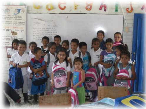
Apoyo Institucional. Minera SEAFIELD S.A.S. 2012

En convenio con la CHEC, la Alcaldía de Quinchía, la Gobernación de Risaralda y el Comité de Cafeteros, se cofinanció el proyecto “CHEC Ilumina el Campo”, llevándole energía eléctrica a 48 familias de la zona rural.