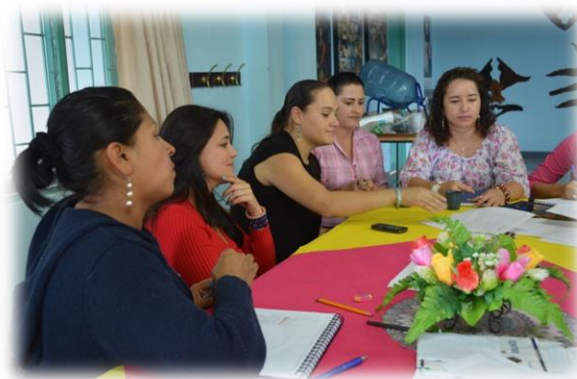
Diplomado en Gestión Social Responsable bajo los Principios del Pacto Global. Minera SEAFIELD S.A.S. 2012