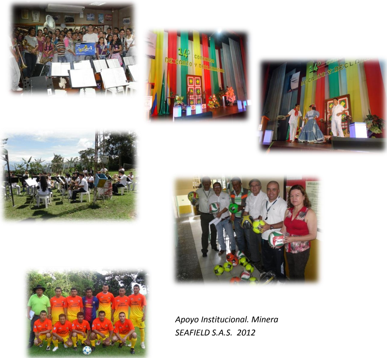
Apoyo Institucional. Minera SEAFIELD S.A.S. 2012

Fomento a la cultura a través del apoyo a la casa de la Cultura de Quinchía en eventos como festivales de teatro, danza, poesía y fomento de la Banda Sinfónica.