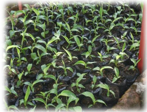
Minera SEAFIELD S.A.S. Apoyo a Procesos Productivos. 2012