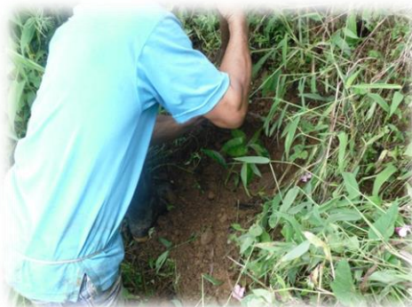
Protección de Cuencas Abastecedoras. Minera SEAFIELD S.A.S. 2012