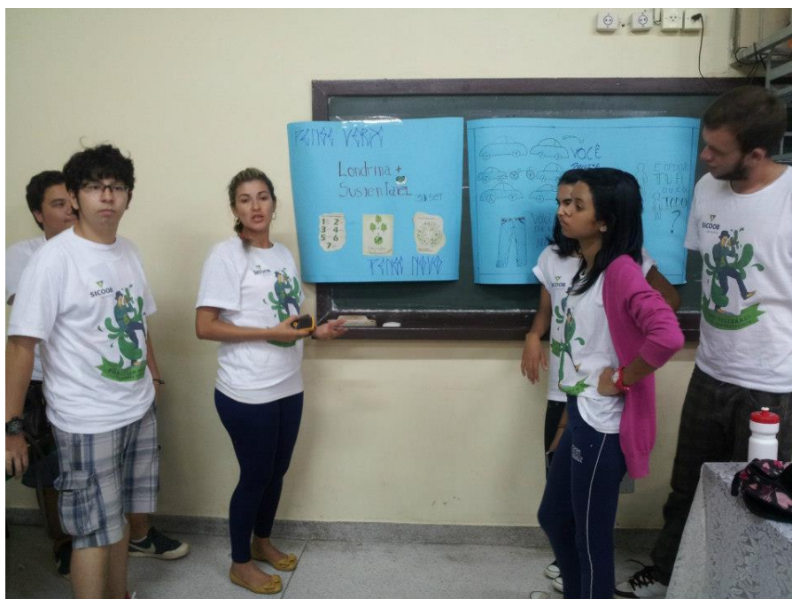
Figura 8 - Apresentação de alunos sobre mobilização social e meio ambiente.