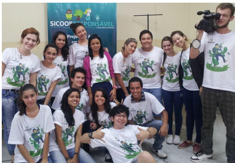
Figura 4 - Uma das turmas participantes do projeto, Colégio IEEL em Londrina.

COOPERATIVA DE CRÉDITO DE LIVRE ADMISSÃO DO NORTE DO PARANÁ - SICOOB NORTE DO PARANÁ