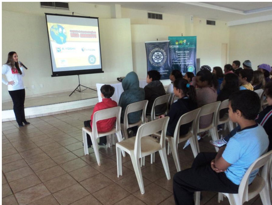
Figura 7 - Parceria com o Instituto Yoshii para o dia do Meio Ambiente

ser distribuída em parceria com instituições locais, como escolas ou Ongs, por meio do desenvolvimento de ações diversas com foco na área ambiental.