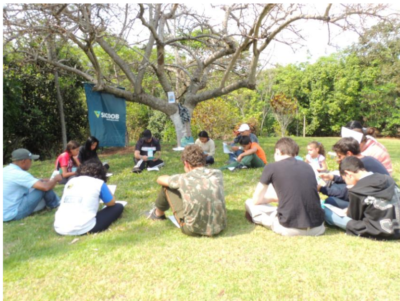
Figura 3 - Palestras e dinâmicas cooperativas no Acampamento da Paz que aconteceu em setembro em Londrina.