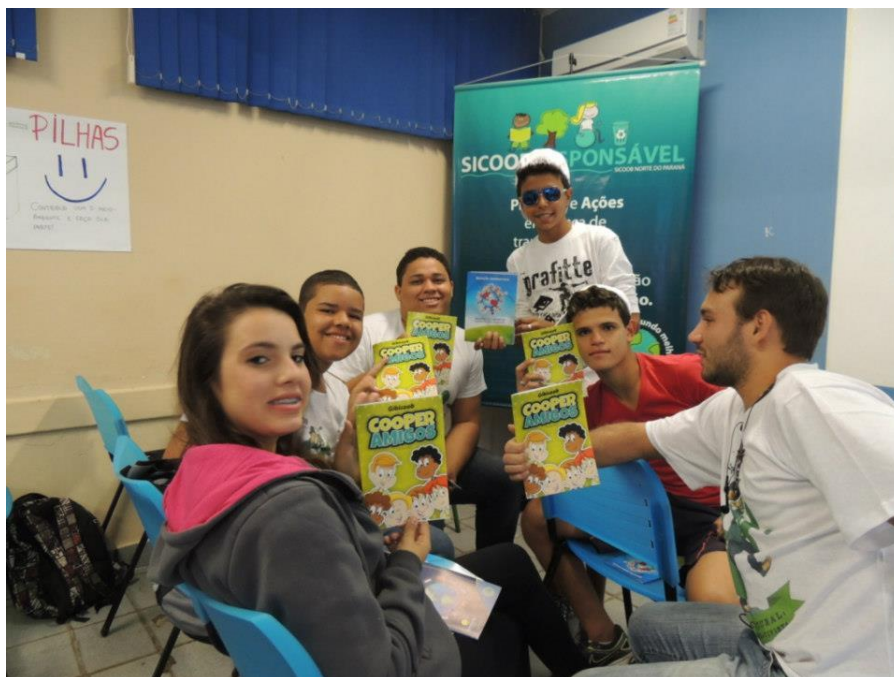
Figura 5 - Entrega do Gibicoob a alunos de escola da região norte de Londrina.