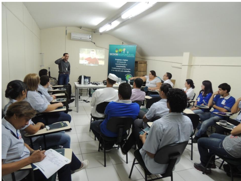
Figura 1 - Palestra no supermercado Cidade Canção. Abril/2014