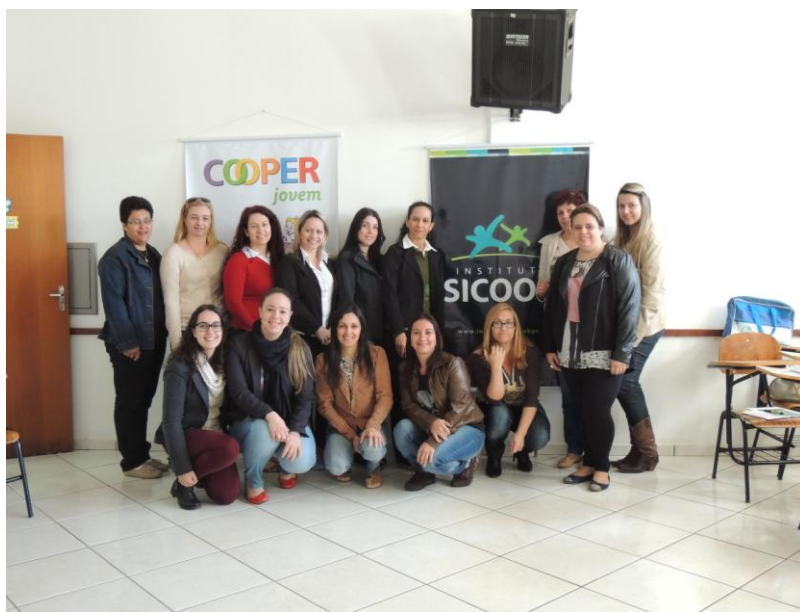
Figura 2 - Turma da capacitação que aconteceu em Carlópolis.