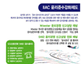
윤리경영 포스트잇 제작, 배포

공항지역 윤리경영 확산프로그램 시행. UNCC 이행과 확산을 위해 인천 공항 현상에 맞는 특화프로그램 (서약식, 프로그램운영, 참여기관 지원)