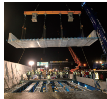
対策工事(プレキャスト床版)