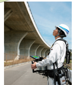
赤外線カメラによる撮影

コンクリートにひび割れや浮きなどがないか、赤外線カメラで撮影し、確認します。目には見えにくい損傷を発見できるほか、現地で打音検査すべき箇所をあらかじめ把握することで、確実に効率的な点検が実施できます。