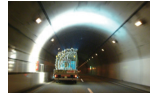
撮影車による点検作業

時速80kmで走行しながら、車両に搭載した高画質のハイビジョンカメラでコンクリート表面を撮影し、映像記録からひび割れなどを自動検出する技術を導入しています。