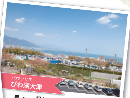
パヴァリエ びわ湖大津