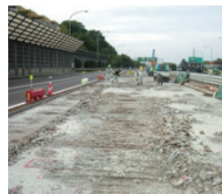
補修前の橋梁(床版部)

橋梁の床版(しょうばん)については、工場で製作したプレキャスト床版への取換えや増厚・防水工事などを実施し、橋梁の耐久性向上・長寿命化を図っています。