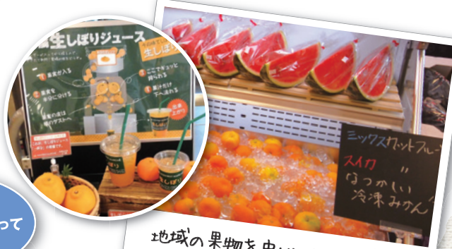
地域の果物を中心に取り揃えた 果物マルシェ

地域の特色を活かして、特別なひとときを演出するエリアです。 郷土料理や名産品を取り揃えるほか、魅力的な観光情報も発信します。