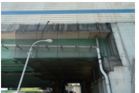
はく落防止ネットを設置した橋梁

劣化したコンクリートがはがれ落ち、第三者に被害が及ぶことを防ぐため、はく落防止ネットの設置などの対策を進めています。