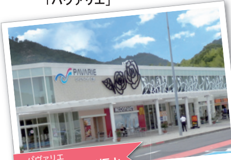
パヴァリエ ローズマインド福山 エリア全体を地元・福山市の 市花「ばら」で演出！