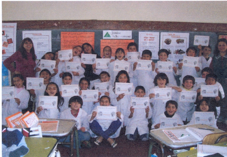
Alumnos del Colegio Manuel Belgrano