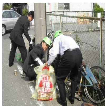
地域清掃活動への参加