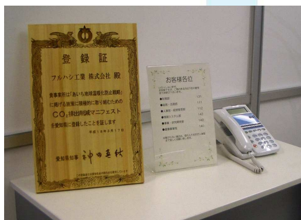
間伐材を利用した登録証