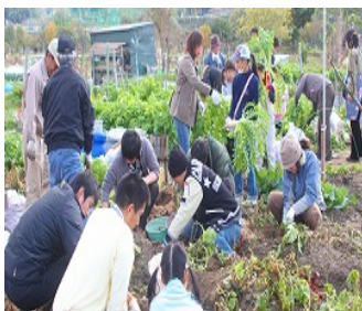
秋の収穫祭の様子