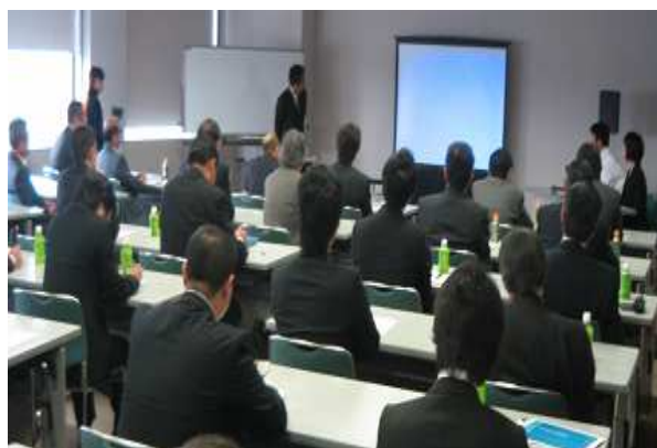
委員会・全社 発表会の様子