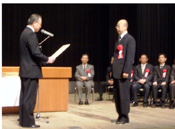
神田知事より登録証授与