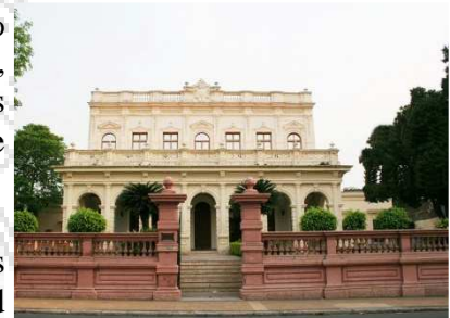
Fachada del Rectorado

Asimismo, cuenta con varios institutos y centros tecnológicos y de investigación que brindan facilidades a la comunidad académica, tanto para la realización de trabajos científicos, como para el desarrollo de estudios de postgrado, que se traducen en aportes a la sociedad.