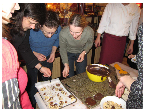
Išvyka į šokolado namus