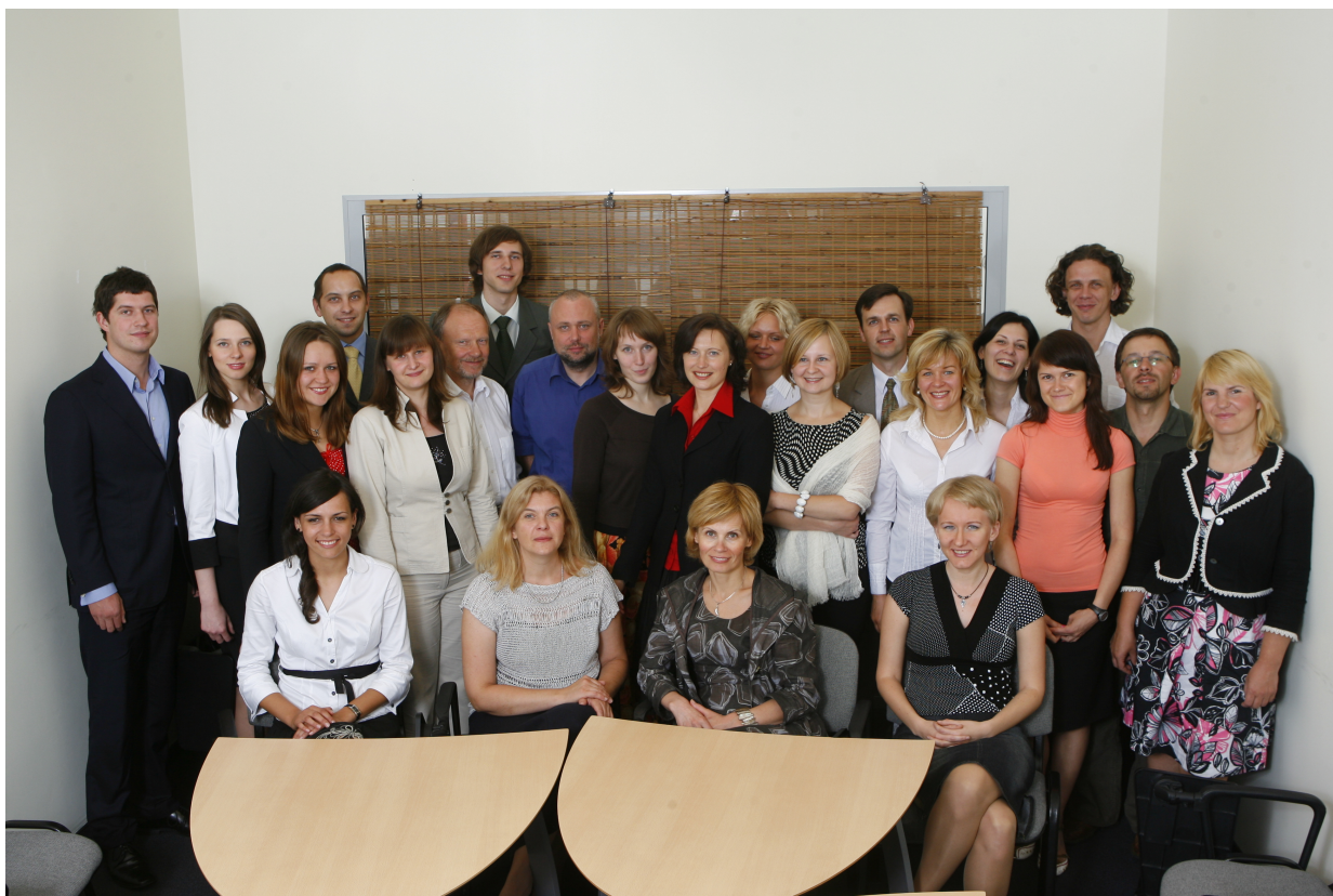
EKT grupės darbuotojų kolektyvas 2008 m.

Įmonės darbuotojai skaito pranešimus konferencijose, rašo pranešimus spaudai, taip prisidedami prie Lietuvos konkurencingumo didinimo regione.