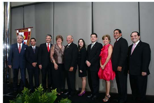
Toma de posesión de Junta Directiva de APEDE

Como resultado, se lanzó la Alianza por la Ética Corporativa entre APEDE y SUMARSE que organizó de manera conjunta la Semana de la Ética en febrero de 2013 y de lo cual se reportará oportunamente en el próximo informe.