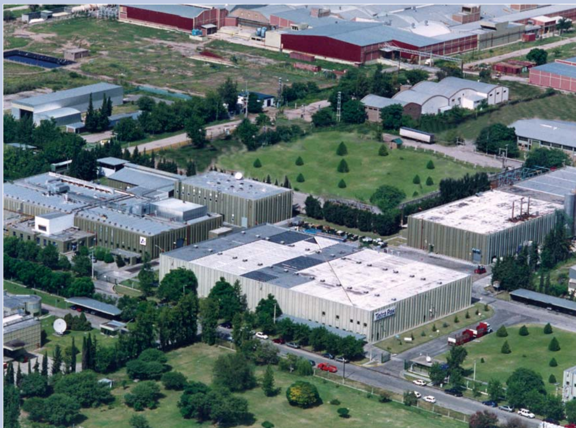
Planta de La Rioja.