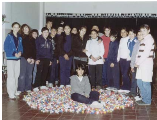
Alumnos de la Escuela Manuel Belgrano

Del mismo modo, también nos sumamos al programa de reciclado de papel, dado que en las oficinas administrativas de la empresa se juntan grandes cantidades de papel.